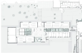
Plan de rez-de-chaussée 1. Entrée 2. Accueil 3. Hall 4. Salles de formations 5. Bureaux des formateurs

Ils sont longés de part et d'autre par un couloir de desserte. Au rez-de-chaussée, sont regroupés les bureaux des formateurs, des espaces de co-working et toutes les salles de formation. Ces dernières se répartissent le long des façades nord, ouest et sud. Le premier et le deuxième étage sont réservés aux bureaux de l'entreprise. De différentes tailles, certains de grande dimension sont traités en open space. Sur ces deux étages, les bureaux sont entièrement modulables en fonction des besoins de l'entreprise et de leurs évolutions. Dans tout le bâtiment, les couloirs sont séparés des salles de formation et des bureaux par des cloisons vitrées sérigraphiées. Les utilisateurs sont ainsi protégés des regards et les circulations bénéficient de la présence de la lumière naturelle qui agrémente les parcours.