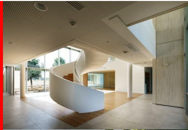
Vue sur le hall et la courbe de l'escalier, avant aménagement.