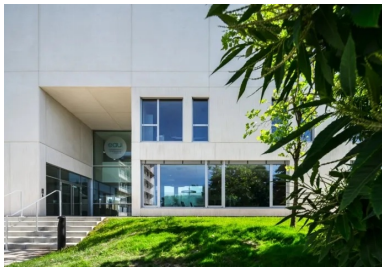
Le hall traversant s'ouvre également au nord et permet de rejoindre directement le centre de formation depuis l'accès principal du site.