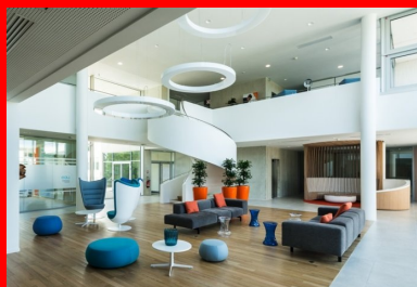
Le hall à la fois double hauteur et traversant est conçu comme un cœur de village, qui accueille, distribue et offre des espaces de détente.

La structure du bâtiment est entièrement réalisée en béton et associe différentes solutions. De façon générale, les dalles de plancher sont portées par les voiles coulés des noyaux servants centraux et les façades porteuses en panneaux préfabriqués de type murs à coffrage et isolation intégrés. Dans certaines parties du projet, lorsqu'il existe un décalage des plans de façade, comme au niveau du grand hall ou quand les panneaux de façade ont une épaisseur de 40 cm. Le voile intérieur, porteur, est de 20 cm et sa face visible dans les salles de formation et bureaux est laissée brute. Le voile de parement extérieur, matricé ou brut, a 8 cm d'épaisseur et l'isolant 12 cm. Ces panneaux participent à la performance du bâtiment qui atteint un niveau conforme à la RT 2012 - 40 %.