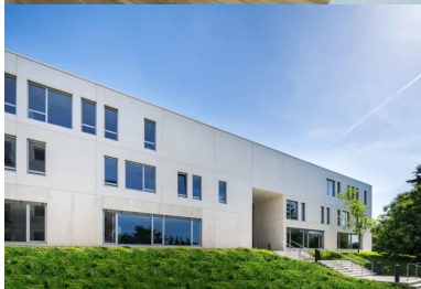
Vue de la façade nord.