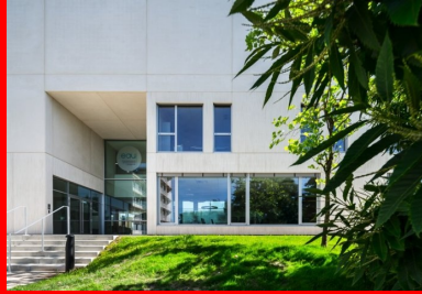
Le hall traversant s'ouvre également au nord et permet de rejoindre directement le centre de formation depuis l'accès principal du site.