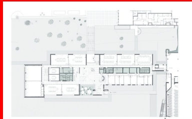
Plan de rez-de-chaussée 1. Entrée 2. Accueil 3. Hall 4. Salles de formations 5. Bureaux des formateurs

Ils sont longés de part et d'autre par un couloir de desserte. Au rez-de-chaussée, sont regroupés les bureaux des formateurs, des espaces de co-working et toutes les salles de formation. Ces dernières se répartissent le long des façades nord, ouest et sud. Le premier et le deuxième étage sont réservés aux bureaux de l'entreprise. De différentes tailles, certains de grande dimension sont traités en open space. Sur ces deux étages, les bureaux sont entièrement modulables en fonction des besoins de l'entreprise et de leurs évolutions. Dans tout le bâtiment, les couloirs sont séparés des salles de formation et des bureaux par des cloisons vitrées sérigraphiées. Les utilisateurs sont ainsi protégés des regards et les circulations bénéficient de la présence de la lumière naturelle qui agrémentent les parcours.