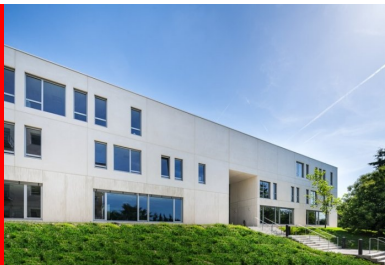
Vue de la façade nord.