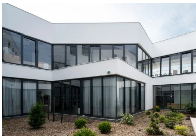
Maison des services publics – Un patio creusé au cœur de la MSP diffuse une abondante lumière dans toutes les salles, à l'étage il est bordé par une déambulation fluide.

De son côté, la Maison des services publics se veut plus musicale avec ses façades faites de fins modules de béton rythmés verticalement. Cette nouvelle structure ayant pour objectif de faciliter les démarches des habitants regroupe pas moins de cinq services en une seule enveloppe. La nature des activités, portées vers l'assistance et l'accueil, dont un certain nombre d'enfants, nécessitait donc de protéger l'intimité des lieux. Le filtre de façade remplit cette fonction. Il protège également du rayonnement solaire sans nuire à la diffusion de la lumière. Celle-ci est d'autant plus abondante que les plateaux sont percés d'un patio central et que les parois nord-ouest sont entièrement vitrées vers de larges terrasses en R+1 et R+2 ainsi que sur un jardin en rez-de-chaussée dont bénéficient les enfants de la crèche. Le gabarit de la MSP s'intègre ainsi parfaitement avec les immeubles d'habitation voisins étagés en escalier. Toute hauteur sur une partie de la rue, le voile de façade se soulève avec douceur pour emmener les usagers jusqu'à l'entrée dans la maison protégée par un porte-à-faux qui entretient une continuité visuelle avec celui du gymnase. Cet écran protecteur qui singularise l'équipement est réalisé à partir d'éléments en béton préfabriqués dont le profil irrégulier présente cinq à six faces et décline cinq modèles. Ils sont fixés en deux points à une solide structure, également de béton, qui en reprend les charges.