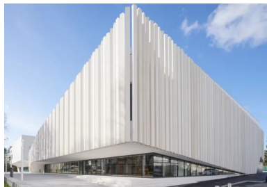
Maison des services publics Gisèle-Halimi - Elle se distingue du gymnase par son voile de façade, celui-ci se soulève pour accompagner l'entrée dans les lieux.

Livrés à 24 mois d'intervalle, le gymnase et la MSP avaient fait l'objet de concours distincts, respectivement en 2017 et 2018. Tous deux furent remportés par l'architecte Christophe Gulizzi, reconnu pour son écriture poétique de béton : « Le jury avait apprécié la continuité des projets dans l'intention et la matérialité », explique le créateur. Partageant une même parcelle issue de la démolition d'un terrain de handball et d'un gymnase particulièrement vétustes, les nouvelles constructions dégagent une forte synergie : implantées en alignement, elles sont associées par un parvis piéton d'une largeur de 8 m. Partiellement abrité de la pluie et du soleil par chacun des bâtiments, ce lieu convivial à ciel ouvert fonctionne comme une place publique centrale.