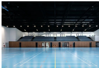
Gymnase - Une nappe structurelle faite de six poutres métalliques en treillis, peintes en noir, permet de franchir les 45 m de portée libre.

Côté parvis, une cavité génère un long mouvement qui accompagne et protège le visiteur, puis elle se retourne côté rue pour définir l'entrée. Cette dernière s'ouvre directement sur le grand hall, lequel canalise et distribue l'ensemble des flux, ceux du public et des sportifs. Dès lors, le plan organisé perpendiculairement autour d'un axe majeur permet de se repérer très facilement dans les lieux. Large de 2 m, il distribue de part et d'autre salles et vestiaires, ainsi que les deux noyaux de circulation verticale donnant accès au niveau supérieur où se trouvent la salle de danse, le dojo et les tribunes.