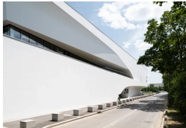
Gymnase - En partie haute du gymnase, une profonde découpe abrite une terrasse qui est accessible depuis le haut des gradins.

Développant une puissante musculature de béton, le gymnase se présente comme un monolithe sculptural et massif. L'effet d'épaisseur est d'autant plus perceptible que chacune de ses façades est évidée par des découpes galbées qui sont comme taillées à la serpe. Complexes, ces entailles ne sont en rien un formalisme gratuit mais servent au mieux les usages de la construction et y introduisent un maximum de lumière naturelle : « La lumière est le matériau que j'utilise le plus », précise Christophe Gulizzi.