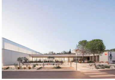
Le béton brut de décoffrage donne une unité à l'ensemble du bâtiment qui se déploie en U autour de l'esplanade.

Imaginé par Panorama Architecture, le pôle sportif universitaire, par sa géométrie simple et sa matérialité sobre affirmées par le béton, trouve sa place dans l'histoire du fort.