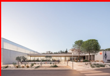
Le béton brut de décoffrage donne une unité à l'ensemble du bâtiment qui se déploie en U autour de l'esplanade.

Imaginé par Panorama Architecture, le pôle sportif universitaire, par sa géométrie simple et sa matérialité sobre affirmées par le béton, trouve sa place dans l'histoire du fort.