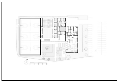
Plan du rez-de-chaussée.