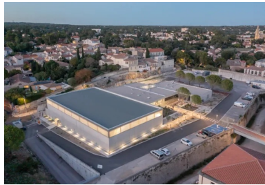
Relié au reste du fort par la passerelle (à droite), le pôle sportif universitaire avec son esplanade paysagée est un espace fédérateur de l'université.

C'est sur cette parcelle en pente, bordée par des voiries au sud et l'ouest et d'un parking à l'est, que prend place le nouveau pôle universitaire sportif livré en 2021 après 16 mois de chantier. Par respect pour l'histoire du lieu, son emprise préserve l'emplacement de l'ancien bastion nord et la trace archéologique du premier mur d'enceinte restés enfouis.