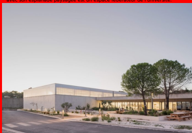
Minéral et lumineux, le bâtiment s'ouvre en façade sud, protégée du soleil et des intempéries par le auvent que forme l'avancée de la toiture.