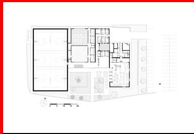
Plan du rez-de-chaussée.

bénéficie d'un accès indépendant. Dédiée à l'enseignement des sciences et techniques des activités physiques et sportives (Staps) et au service universitaire des activités physiques et sportives (Suaps), l'espace sportif comprend une salle multisport et des salles annexes de danse et d'arts martiaux (un dojo).