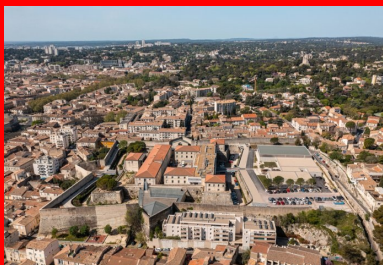
Vue aérienne qui permet de deviner l'emprise initiale du fort et son extension, au nord, dans laquelle prend place le pôle sportif universitaire.