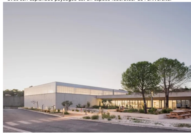
Minéral et lumineux, le bâtiment s'ouvre en façade sud, protégée du soleil et des intempéries par l'avant que forme l'avancée de la toiture.