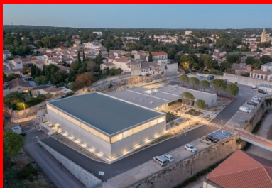
Relié au reste du fort par la passerelle (à droite), le pôle sportif universitaire avec son esplanade paysagée est un espace fédérateur de l'université.

C'est sur cette parcelle en pente, bordée par des voiries au sud et l'ouest et d'un parking à l'est, que prend place le nouveau pôle universitaire sportif livré en 2021 après 16 mois de chantier. Par respect pour l'histoire du lieu, son emprise préserve l'emplacement de l'ancien bastion nord et la trace archéologique du premier mur d'enceinte restés enfouis.