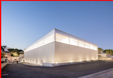
Volume simple et épuré mis en valeur par le béton de ciment clair.