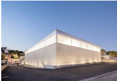
Volume simple et épuré mis en valeur par le béton de ciment clair.