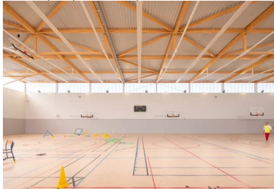
La lumière naturelle et le choix d'une palette de teintes claire, au sol comme sur les murs, apportent une impression de légèreté au volume de la salle multisport.