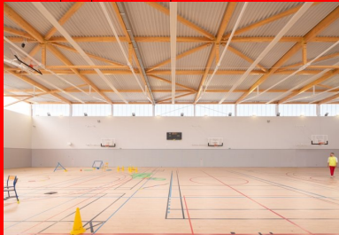
La lumière naturelle et le choix d'une palette de teintes claires, au sol comme sur les murs, apportent une impression de légèreté au volume de la salle multisport.