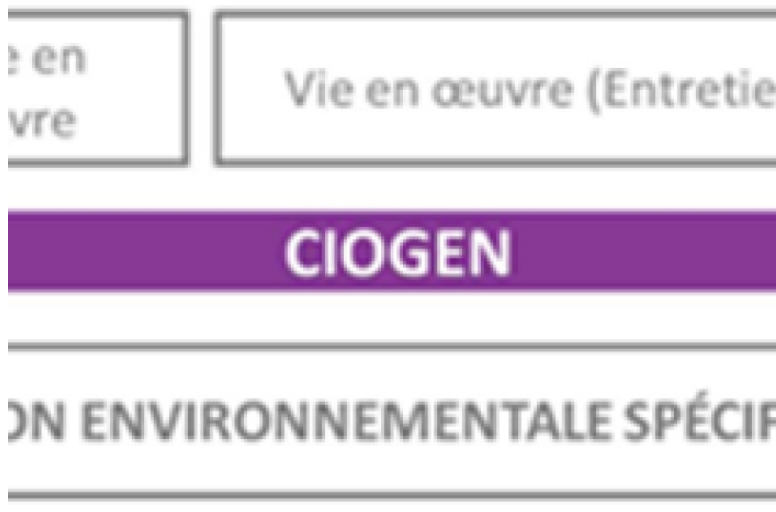
Illustration 3 : CIOGEN, évaluation des impacts environnementaux sur l'ensemble du cycle de vie de l'ouvrage