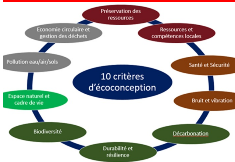
Illustration 4 : Ecoconception des ouvrages de génie civil en 4 principes et 10 critères

couvertes, ouvrages souterrains, ouvrages en site maritime, ouvrages en site fluvial, ...), y compris dans le cadre de réparation et de réhabilitation.