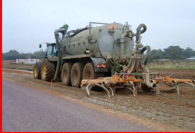
La teneur en eau du sol est ajustée à la teneur de l'optimum Proctor à l'aide d'une arroseuse-enfouisseuse.