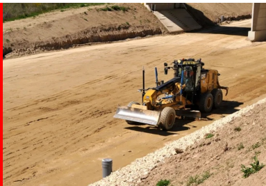
Réglage à la niveleuse pour obtenir un profil en long très régulier.