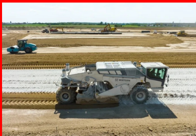
Le sol est malaxé avec le liant à l'aide d'un pulvimixeur moderne. Au fond, un compacteur en action.