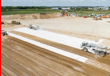
Atelier de traitement. Au fond un épandeur de liant en action et au premier plan deux pulvimixeurs mélangent le liant avec le sol sur une épaisseur bien définie.