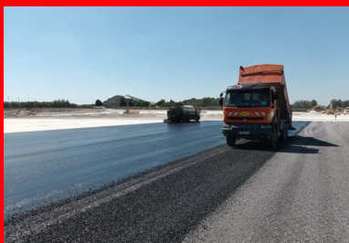
Atelier de mise en œuvre de l'enduit bicouche clouté dont le rôle est d'assurer la protection du sol traité.

Après le cloutage de la surface de la CDF à l'aide de gravillons 10/14 mm, un enduit de cure bicouche clouté (4/6 mm) est appliqué pour protéger la CDF et pour assurer la bonne prise hydraulique du mélange. Une couche d'accrochage est réalisée dans un second temps, pour garantir un bon collage à l'interface entre la CDF et les produits bitumineux mis en œuvre. À noter que la circulation des véhicules est neutralisée pendant un délai de sept jours, pour ne pas rompre la prise hydraulique. Ce délai a été déterminé par des mesures de déflexion.