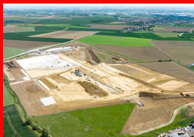
Vue générale du chantier de terrassement.

Ensuite, pour réaliser la plate-forme support, il faut, dans un premier temps, acheminer le limon de récupération du dépôt provisoire (approvisionnement avec reprise sur stock à l'aide d'une pelle sur chenilles et de tombereaux articulés) puis mettre en œuvre le matériau sur une épaisseur adéquate pour atteindre la cote fixée par la conception du projet.