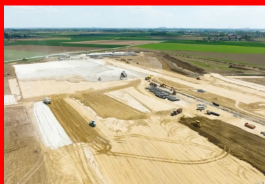
Vue générale des travaux de terrassement de la plate-forme logistique d'Ililies et Salomé.

Un entrepôt logistique de 9,6 hectares de superficie (96 000 m 2 ) est en construction sur un terrain de 24,6 hectares sis dans les communes d'Ililies et de Salomé, à proximité de Lille. Il ouvrira ses portes à la fin de l'année 2023. Une plate-forme support traitée aux liants hydrauliques routiers ROC TR et ROC VDS d'EQIOM soutient ce nouveau complexe et a permis de réaliser les aménagements extérieurs ainsi que le réseau de voies lourdement circulées.