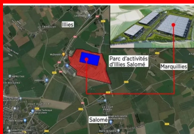
Figure 1. Plan de situation et vue d'artiste du nouveau parc logistique PRD, dont la livraison est prévue fin 2023. Achievé, le bâtiment principal aura une superficie de 96 000 m 2 .

Situé sur les communes d'Ililies et de Salomé, le nouveau parc logistique bénéficie d'une position stratégique au carrefour des routes nationales RN41 et RN47 ; il est facilement accessible par les autoroutes A25, A1, A21 et A26. Les entrepôts en location, situés dans le Distripôle Lille Métropole d'Ililies-Salomé, à proximité de Lille (20 km), se trouvent au cœur de l'Europe : à 35 minutes de Bruxelles, à 60 minutes de Paris et à 80 minutes de Londres par TGV. Ce projet confirme l'importance de la région Hauts-de-France sur le marché de la logistique européenne.