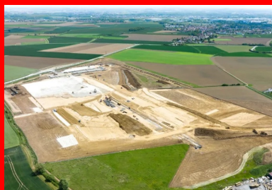
Vue générale du chantier de terrassement.

Ensuite, pour réaliser la plate-forme support, il faut, dans un premier temps, acheminer le limon de récupération du dépôt provisoire (approvisionnement avec reprise sur stock à l'aide d'une pelle sur chenilles et de tombereaux articulés) puis mettre en œuvre le matériau sur une épaisseur adéquate pour atteindre la cote fixée par la conception du projet.