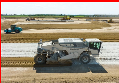
Le sol est malaxé avec le liant à l'aide d'un pulvimixeur moderne. Au fond, un compacteur en action.