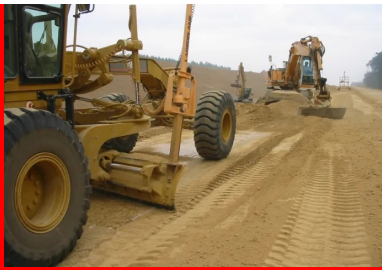
Mise à la côte du matériau avant le passage de l'atelier de traitement.