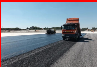
Atelier de mise en œuvre de l'enduit bicouche clouté dont le rôle est d'assurer la protection du sol traité.

Après le cloutage de la surface de la CDF à l'aide de gravillons 10/14 mm, un enduit de cure bicouche clouté (4/6 mm) est appliqué pour protéger la CDF et pour assurer la bonne prise hydraulique du mélange. Une couche d'accrochage est réalisée dans un second temps, pour garantir un bon collage à l'interface entre la CDF et les produits bitumineux mis en œuvre. À noter que la circulation des véhicules est neutralisée pendant un délai de sept jours, pour ne pas rompre la prise hydraulique. Ce délai a été déterminé par des mesures de déflexion.