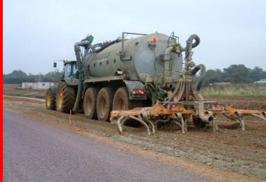
La teneur en eau du sol est ajustée à la teneur de l'optimum Proctor à l'aide d'une arroseuse-enfouisseuse.