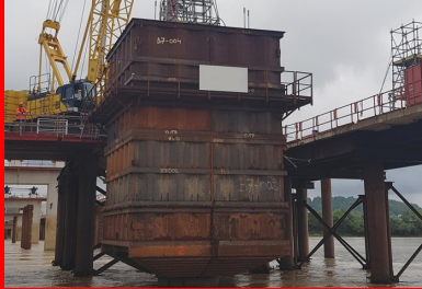
Chaque fût de pile est bétonné à l'intérieur d'un caisson étanche solidarisé au pieu de fondation, ce qui permet de limiter les affouillements.

Pour finaliser la structure de l'ouvrage restait à réaliser le hourdis béton. « Il faut s'imaginer une dalle en béton armé de 25 000 m 2 , soit l'équivalent de quatre terrains de football ! », s'enthousiasme Thomas Chavignier. Pour couvrir cette surface exceptionnelle, une méthodologie minutieusement planifiée est déployée. Le tablier a été divisé longitudinalement en deux zones principales : le tablier amont et le tablier aval. Chacune de ces zones est subdivisée en 39 plots d'environ 320 m 2 . La réalisation de chaque plot mobilise une dizaine de compagnons, impliqués dans les opérations de coffrage/décoffrage et de bétonnage.