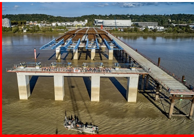
Le chevêtre de chaque pile (3 m de long et 2,2 m de haut) est réalisé au-dessus des quatre poteaux.