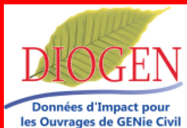
Logo DIOGEN.

Comment les données sont-elles construites dans la base de données DIOGEN ?