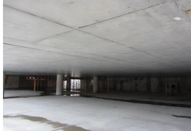
Parking Gérard Philippe - La Garde (Var). La technique des planchers précontraints par post-tension est particulièrement bien adaptée à la configuration des parkings. Les dalles plates permettent de dégager de vastes trames sans poteau (ici 15 m x 8 m), ce qui optimise la répartition des places de stationnement et la circulation des voitures. Par ailleurs, l'absence de poutre dessine des surfaces régulières facilitant le passage des réseaux et simplifiant la cinétique de ventilation.

Procédé inventé par le célèbre ingénieur Français, Eugène Freyssinet en 1928, le béton précontraint a révolutionné l'art et la science de la construction. Cette technique, qui augmente durablement la résistance des structures (voir encadré 1), permet notamment d'allonger les portées entre appuis ou d'affiner les éléments porteurs, en comparaison de procédés plus classiques comme le béton armé . Généralement associée aux ouvrages de génie civil, en particulier les ponts de grandes portées ou les équipements exceptionnels comme les enceintes nucléaires ou les stades, son utilisation dans le bâtiment est souvent peu connue en France.