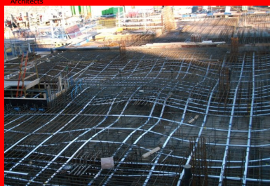
Hôpital Mater - Dublin (Irlande). Les câbles de précontrainte sont installés en suivant une forme de « vague ». Cette ligne suit la courbe des moments des forces qui s'exercent dans le plancher.