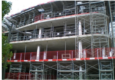
Pavillon 52 - Lyon Confluences. Coulés en place, les planchers précontraints par post-tension disposent d'une souplesse de mise en œuvre qui s'adapte aux courbes irrégulières des différents niveaux.