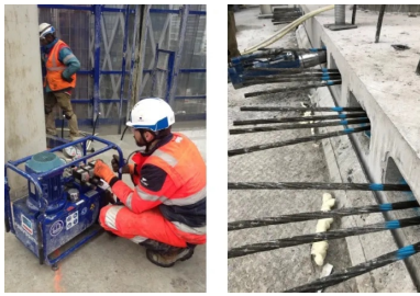
Tour Hekla - La Défense. Après que le béton a atteint une certaine résistance, les câbles sont tendus à l'aide d'une pompe hydraulique (à gauche). Lors de cette étape, l'extrémité libre de chaque câble est tirée par des vérins vers l'extérieur, ce qui a pour effet de comprimer le béton entre les points d'ancrage des câbles. Un effort de 22,3 tonnes est appliqué sur chaque câble.