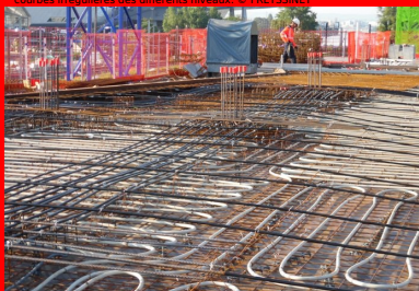
Pavillon 52 - Lyon Confluences. Intégrant avant coulage un échangeur thermique alimenté par la nappe phréatique (tubes blancs sur la photo), les planchers précontraints assurent le chauffage-rafraîchissement de l'immeuble. L'absence de poutres garantit une distribution thermique uniforme sur toute la surface.