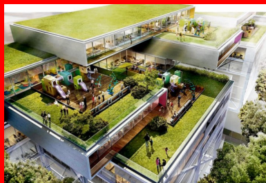
Hôpital Mater - Dublin (Irlande). En dégageant de vastes plateaux, les planchers précontraints par post-tension permettent une grande flexibilité dans l'aménagement intérieur. Cette flexibilité est particulièrement précieuse dans les hôpitaux, où l'espace peut devoir être réaménagé pour répondre à de nouvelles exigences ou technologies médicales. Par ailleurs, la grande capacité portante de ces planchers leur permet de supporter facilement de lourds équipements médicaux (scanners, équipements de radiologie...).