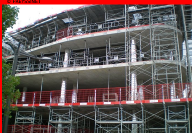
Pavillon 52 - Lyon Confluences. Coulés en place, les planchers précontraints par post-tension disposent d'une souplesse de mise en œuvre qui s'adapte aux courbes irrégulières des différents niveaux.