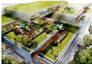
Hôpital Mater - Dublin (Irlande). En dégageant de vastes plateaux, les planchers précontraints par post-tension permettent une grande flexibilité dans l'aménagement intérieur. Cette flexibilité est particulièrement précieuse dans les hôpitaux, où l'espace peut devoir être réaménagé pour répondre à de nouvelles exigences ou technologies médicales. Par ailleurs, la grande capacité portante de ces planchers leur permet de supporter facilement de lourds équipements médicaux (scanners, équipements de radiologie...).