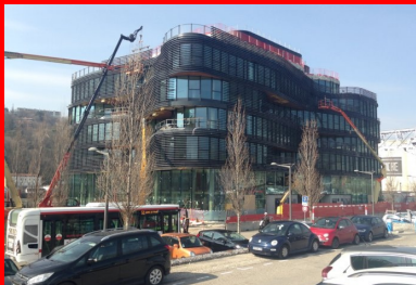
Le Pavillon 52 - situé dans le quartier Lyon Confluences (Rhône). Cet immeuble de bureaux en R+6, conçu par l'architecte Rudy Ricciotti, développe une surface de 7 700 m 2 . La technique des planchers précontraints par post-tension a été choisie par le maître d'œuvre pour au moins trois raisons : la nécessité de disposer de grands plateaux, la capacité à épouser les formes ondulantes des différents niveaux, et la possibilité d'y intégrer un système de plafond chauffant.

Ces arguments environnementaux pèsent de tout leur poids à l'heure où la réglementation environnementale RE 2020, en vigueur depuis le 1er janvier 2022, impose une limitation de l'impact carbone des bâtiments sur l'ensemble de leur cycle de vie , et notamment pendant les phases de construction et d'exploitation.