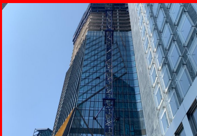
Tour Hekla - La Défense (Hauts-de-Seine, architecte Jean Nouvel). Les 46 niveaux de cette tour de 220 mètres de haut sont constitués de planchers précontraints par post-tension. Cette solution technique permettait de s'adapter à la forme unique et complexe de la tour - tous les planchers disposent d'une géométrie unique - tout en respectant les délais de construction et en diminuant l'empreinte carbone de l'ouvrage de 30 % par la réduction des quantités de béton et d'armatures d'acier.

En phase de construction, certaines étapes de mise en œuvre sont allégées – suppression des coffrages des retombées de poutre – réduction ou suppression des joints de dilatation – ou simplifiées – gestion des réservations pour les réseaux. Enfin, tout au long de la vie de l'immeuble, le maître d'ouvrage diminue ses charges d'exploitation et d'entretien. « Au final, une étude économique comparative réalisée pour chaque projet démontre la diminution des coûts réels globaux pour le donneur d'ordres », résume Ivica Zivanovic.