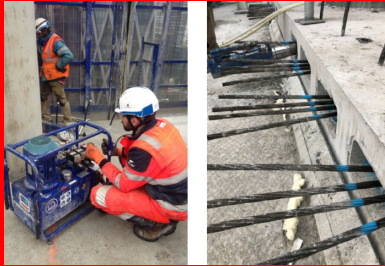
Tour Hekla - La Défense. Après que le béton a atteint une certaine résistance, les câbles sont tendus à l'aide d'une pompe hydraulique (à gauche). Lors de cette étape, l'extrémité libre de chaque câble est tirée par des vérins vers l'extérieur, ce qui a pour effet de comprimer le béton entre les points d'ancrage des câbles. Un effort de 22,3 tonnes est appliqué sur chaque câble.