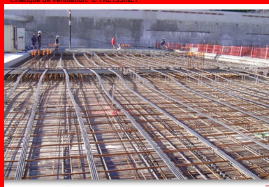
Parking Gérard Philipe - La Garde (Var). Installation des câbles de précontrainte avant coulage, longitudinalement et transversalement. La compression générée par la précontrainte permet de diminuer la quantité d'armatures passives.