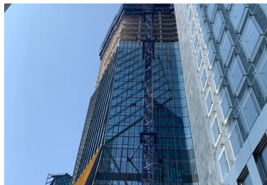
Tour Hekla - La Défense (Hauts-de-Seine, architecte Jean Nouvel). Les 46 niveaux de cette tour de 220 mètres de haut sont constitués de planchers précontraints par post-tension. Cette solution technique permettait de s'adapter à la forme unique et complexe de la tour - tous les planchers disposent d'une géométrie unique - tout en respectant les délais de construction et en diminuant l'empreinte carbone de l'ouvrage de 30 % par la réduction des quantités de béton et d'armatures d'acier.

En phase de construction, certaines étapes de mise en œuvre sont allégées - suppression des coffrages des retombées de poutre , réduction ou suppression des joints de dilatation - ou simplifiées - gestion des réservations pour les réseaux. Enfin, tout au long de la vie de l'immeuble, le maître d'ouvrage diminue ses charges d'exploitation et d'entretien. « Au final, une étude économique comparative réalisée pour chaque projet démontre la diminution des coûts réels globaux pour le donneur d'ordres », résume Ivica Zivanovic.