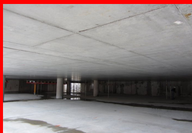
Parking Gérard Philipe - La Garde (Var). La technique des planchers précontraints par post-tension est particulièrement bien adaptée à la configuration des parkings. Les dalles plates permettent de dégager de vastes trames sans poteau (ici 15 m x 8 m), ce qui optimise la répartition des places de stationnement et la circulation des voitures. Par ailleurs, l'absence de poutre dessine des surfaces régulières facilitant le passage des réseaux et simplifiant la technique de ventilation.

Procédé inventé par le célèbre ingénieur Français, Eugène Freyssinet en 1928, le béton précontraint a révolutionné l'art et la science de la construction. Cette technique, qui augmente durablement la résistance des structures (voir encadré 1), permet notamment d'allonger les portées entre appuis ou d'affiner les éléments porteurs, en comparaison de procédés plus classiques comme le béton armé . Généralement associée aux ouvrages de génie civil, en particulier les ponts de grandes portées ou les équipements exceptionnels comme les enceintes nucléaires ou les stades, son utilisation dans le bâtiment est souvent peu connue en France.