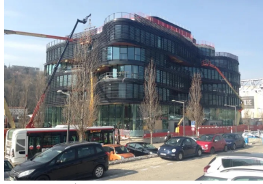
Le Pavillon 52 - situé dans le quartier Lyon Confluences (Rhône). Cet immeuble de bureaux en R+6, conçu par l'architecte Rudy Ricciotti, développe une surface de 7 700 m 2 . La technique des planchers précontraints par post-tension a été choisie par le maître d'œuvre pour au moins trois raisons : la nécessité de disposer de grands plateaux, la capacité à épouser les formes ondulantes des différents niveaux, et la possibilité d'y intégrer un système de plafond chauffant. © FREYSSINET

Ces arguments environnementaux pèsent de tout leur poids à l'heure où la réglementation environnementale RE 2020, en vigueur depuis le 1er janvier 2022, impose une limitation de l'impact carbone des bâtiments sur l'ensemble de leur cycle de vie , et notamment pendant les phases de construction et d'exploitation.