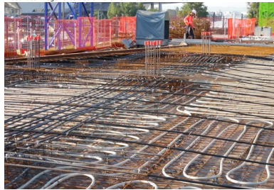
Pavillon 52 - Lyon Confluences. Intégrant avant coulage un échangeur thermique alimenté par la nappe phréatique (tubes blancs sur la photo), les planchers précontraints assurent le chauffage-rafraîchissement de l'immeuble. L'absence de poutres garantit une distribution thermique uniforme sur toute la surface.