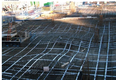
Hôpital Mater - Dublin (Irlande). Les câbles de précontrainte sont installés en suivant une forme de « vague ». Cette ligne suit la courbe des moments des forces qui s'exercent dans le plancher.