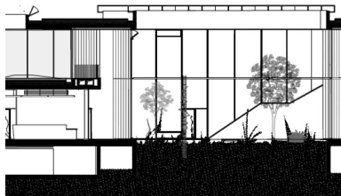
Coupe sur le Patio

Pousser les limites de la technique et de la matière, telle est la quête du binôme R. Ricciotti et R.-F. Ricciotti, père et fils, respectivement architecte et ingénieur, tous deux passionnés par les actes de concevoir et de construire – process qui selon eux ne pourrait pleinement s'épanouir sans l'apport indispensable du savoir-faire des entreprises, avec à la clé de leur collaboration le maintien et le développement d'une culture technique riche et évolutive. Elle s'illustre ici parfaitement, que ce soit lors de la mise en œuvre des ouvrages postcontraints ou lors de l'élaboration des poteaux de l'exostructure. Une modélisation en 3D a permis à l'architecte de transmettre les bons paramètres au préfabricant qui a pu affiner le nombre de moules en utilisant un séquençage de branches fixes et de têtes de poteaux réutilisables.