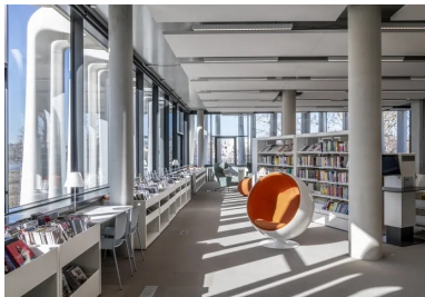
Les espaces de consultation et d'animation sont fluides, lumineux et confortables, propices au calme et à la concentration.