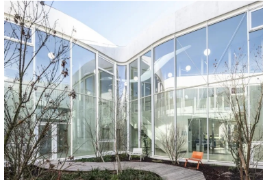
Pivot central du projet, le large patio végétalisé est ouvert à tous par beau temps.