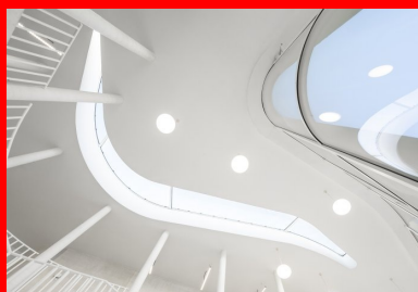
Les circulations organisées autour du patio sont baignées de lumière naturelle.

En termes de performance environnementale, la médiathèque est conçue comme un bâtiment à énergie positive dans une démarche BEPOS, sans certification mais conforme à la RT 2021. Le process intègre une approche mixte entre dispositifs physiques de contrôle des apports solaires et une réduction des consommations d'énergie par les équipements via une étude en simulation thermique dynamique . En façade , les poteaux jouent le rôle de protection solaire et de masque. Ils sont complétés de vitrages à contrôle solaire et de stores textiles pour un confort optimisé. Au centre du bâtiment, le patio joue le rôle de tampon thermique et permet de ventiler le bâtiment naturellement. A l'intérieur, la climatisation est remplacée par un dispositif de planchers rayonnants et rafraîchissants. Reste à ajouter que le béton employé est issu des filières bas carbone avec utilisation des laitiers de hauts-fourneaux. Clairement, les matériaux et les équipements de qualité suivent l'ambition du projet, celui d'offrir un lieu de vie et d'échange qui donne envie d'y revenir. D'ailleurs, les chiffres en disent long... dès la première année, la fréquentation dépasse largement les prévisions. Une réussite.