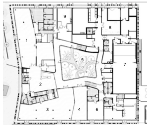
Plan de rez-de-chaussée 1. Café social club, salle des initiés, et cuisine 2. Accueil et orientation 3. Espace enfance famille 4. Ludothèque 5. Patio 6. Accueil loisirs et salle d'animat 7. Salle de spectac 8. Espaces techniq 9. FabLab