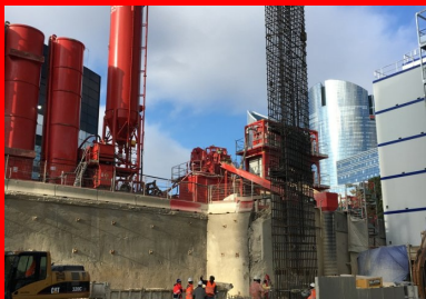
Levage de la cage d'armature d'une paroi moulée avant son installation dans la tranchée. Cette phase spectaculaire permet de se rendre compte des dimensions exceptionnelles de l'excavation.

Les travaux se sont poursuivis par la réalisation de la poutre de couronnement qui surmonte la paroi moulée. « En liaisonnant structurellement les panneaux entre eux, cette poutre massive – 3 à 6 mètres de hauteur pour 1 mètre d'épaisseur – permet de diffuser les charges verticales de la tour de manière homogène sur les panneaux de paroi moulée sous-jacents », précise Arnaud Lelimosin.