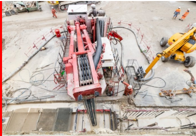
Excavation en cours dans la tranchée d'un panneau de la future paroi moulée. La boue bentonitique affleure. Celle-ci est injectée au fur et à mesure de la réalisation de l'excavation. Ces propriétés thixotropiques lui permettent de stabiliser les parois du trou de forage et d'empêcher le sol de s'effondrer.