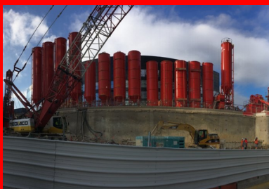
Après l'équipement de la tranchée avec la cage d'armature, des tubes plongeurs sont installés pour permettre le bétonnage en continu et sans interruption depuis le fond de la tranchée. Grâce à ces tubes, le béton se substitue au fluide d'excavation.

Puis les terrassements à l'intérieur de l'enceinte formée par la paroi moulée ont pu démarrer, afin de l'éviter. Au fur et à mesure de l'excavation, des paliers étaient ménagés sur la plateforme pour pouvoir installer des tirants d'ancrage. « Ces tirants précontraints provisoires, d'une vingtaine de mètres de long, étaient mis en place à travers la paroi. En contrant la poussée des terres, ils permettaient de tenir la paroi moulée, ou du moins d'en limiter la déformation à l'avancement. » En tout, jusqu'à quatre niveaux de tirants d'ancrage ont été mis en place sur toute la hauteur de la paroi jusqu'au fond de fouille, à 22 mètres de profondeur.