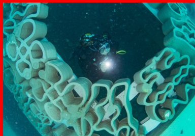
Outre ses vertus écologiques, le design de ce gigantesque récif artificiel répond aussi aux attentes des clubs de plongée.