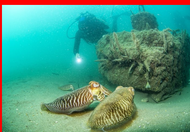
Très vite, ils ont servi de support à la flore et accueilli des œufs de calmars.

L'immersion de 34 récifs en béton réalisés en 3D n'est là que l'une des quatre opérations du projet Récif'lab porté par la ville d'Agde et mis en œuvre par l'entreprise montpelliéraine Seaboost, Lauréat en 2018 d'un programme d'investissement d'avenir, Récif'lab vise un objectif très concret : protéger et reconquérir la biodiversité marine endémique par une approche innovante.