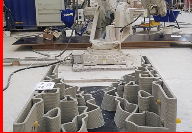
Leur design biomimétique permet d'accueillir la biodiversité marine.

Réalisé en impression 3D , le module central est un portique poteaux/poutres en béton armé dimensionné par le bureau d'ingénierie Lamoureux et Ricciotti. « La conception structurelle a été très spéciale en raison des efforts hydrostatiques et hydrodynamiques de la houle qui s'élève à plusieurs tonnes au mètre carré, soit dix à cent fois plus qu'un ouvrage de bâtiment classique, assure Romain Ricciotti. Par ailleurs, la manutention en mer est un autre facteur dimensionnant compte tenu du gabarit et des 105 t à soulever et à transporter sur barge avant l'immersion finale. »