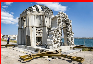
Au cœur du village de récifs artificiels, le module central mesure 6,50 m de haut sur une base de 48 m 2 .

Ecole centrale de Marseille a contribué aux études en bassin à houle pour déterminer les dimensions des modules les mieux adaptées aux conditions hydrodynamiques du site. Les lests conçus par Seaboost ont été réalisés à « l'encre 3D béton » de Vicat grâce à la technologie d'impression 3D d'XtreeE. Fabriqués à Paris, transportés à La Seyne-sur-Mer, acheminés par navire jusqu'au Cap d'Agde, les Xreef ont été immergés fin mai 2019 par l'entreprise Foselev Marine. L'ampleur du déploiement est une première mondiale, qui permet de créer un corridor écologique pérenne tout en optimisant, à moyen terme, les coûts de gestion et le bilan carbone du balisage en mer.