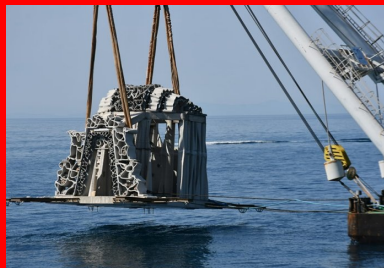
Immersion du module central au large de l'île de Brescou.

Une fois le socle ferrailé, le béton est coulé en place. Sa formulation est le fruit d'un partenariat avec Seaboost, l'université de chimie de Montpellier, Calcia et Superbloc, producteurs de béton BPE . Elle répond à plusieurs exigences : une classe d'exposition XS2 pour tenir les chlorures marins, une faible empreinte carbone et une résistance très élevée (C60/75) pour que la dalle portante, malgré sa finesse, supporte le levage et le transport maritime. Pour ce faire, le groupement a utilisé le ciment CEMIII/A de Calcia, particulièrement résistant aux agressions chimiques en milieu marin, qui permet en outre d'améliorer à 40 % l'empreinte environnementale du béton. Il a ensuite été réalisé dans la centrale d'Assas (34) de l'entreprise Superbloc « en veillant à ce que le béton garde ses caractéristiques de fluidité S5 pendant 2 h, le temps du transport en camion malaxeur à Frontignan où se passait la mise en œuvre de la structure », comme le précise Olivier Pascal, gérant de Superbloc.