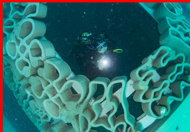
Outre ses vertus écologiques, le design de ce gigantesque récif artificiel répond aussi aux attentes des clubs de plongée.