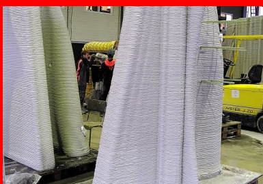
Des coques en béton imprimées 3D par dépôt de couches successives sont apposées sur la structure en béton armé pour servir de coffrage.

Le lot 4 concerne la conception et l'immersion d'un « village » de récifs artificiels. Composé d'embrochements et de plusieurs types de récifs secondaires disposés autour d'un module principal haut de trois étages, il s'étend sur plus de 1 000 m à 20 m de profondeur. L'ensemble sert à protéger l'habitat marin coralligène en déportant une partie de l'activité de plongée.