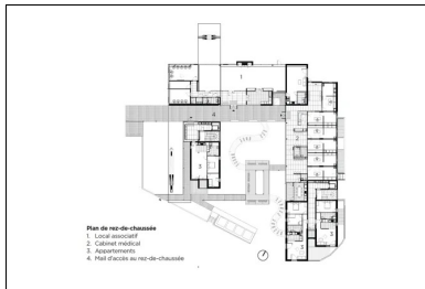
Plan de rez-de-chaussée 1. Local associatif 2. Cabinet médical 3. Appartements 4. Patio d'accès au rez-de-chaussée

Dans une continuité programmatique, les vingt-six logements - des T1bis, T2 et T3, de 46 et 64,5 m 2 - sont tous réservés à des seniors et adaptés à la baisse de mobilité qui accompagne souvent le vieillissement : des aménagements simples qui favorisent le maintien à domicile (douche à l'italienne, barres d'appui, toilettes rehaussées). Outre les appartements, un local associatif et un cabinet médical complètent le programme.