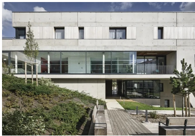
Façade ouest sur l'intérieur de l'îlot. La partie en béton brut abrite les appartements et la façade vitrée le cabinet médical.

Au cœur du quartier résidentiel Haut-Graville, dans un faubourg de la ville haute du Havre, l'opération les Hallates remplace une ancienne résidence pour personnes âgées qui a dû être démolie. « Le projet se trouve à la charnière entre l'individuel et le collectif, le dense et le diffus, le logement social et les maisons particulières », mettent en avant les architectes. Il s'inscrit sur une parcelle en pente, bordée au nord et à l'est d'un tissu pavillonnaire constitué principalement de petites maisons du début du XX e siècle et, au sud et à l'ouest, par de grands ensembles de logements sociaux des années 1960-1970.