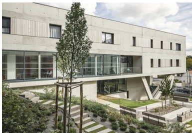
Façade ouest côté jardin. La simplicité formelle apparente du bâtiment contraste avec le terrain accidenté sur lequel il se déploie.

Avec deux barrettes de béton parallèles, légèrement décalées et décollées du sol, l'opération de logements signée Agapé architectes marque la transition entre deux bâtis.