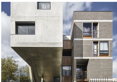
Pignon sud qui permet de comprendre le traitement des deux faces d'une barrette avec ce glissement autour du couloir.

Seuls les poteaux inclinés - dits « brésiliens » en référence à l'architecte d'Oscar Niemeyer -, qui supportent le porte-à-faux de 3,5 m, sont préfabriqués.