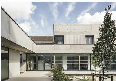
Les deux équipements qui accompagnent l'opération de logement bénéficient de la vue sur le jardin.

Placé sous le porte-à-faux et entièrement vitré, le hall d'entrée bénéficie d'un rapport à l'extérieur très ouvert. Le soin apporté à cet espace d'accueil, jusque dans la mise en valeur des boîtes aux lettres comprises dans un cadre en béton, lui confère une qualité spatiale propice aux échanges.