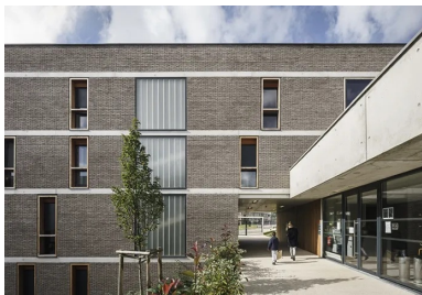
Façade est en brique. Le mail qui longe le local associatif rejoint la rue et offre une percée visuelle sur l'intérieur de l'îlot.

Bien que résidentialisée, l'opération est traversée par un mail est-ouest qui relie les rues au patio , passant en porche sous les deux barrettes et le long du local associatif. Encastré dans la pente, un niveau semi-enterré accueille les locaux poussettes et vélos et des locaux techniques occupent le niveau le plus bas. C'est là qu'est notamment placée la sous-station, l'immeuble étant raccordé au réseau de chaleur urbain. En toiture, pas d'urgence mais un revêtement gravillonné étanche.