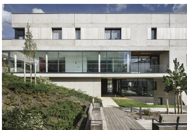
Façade ouest sur l'intérieur de l'îlot. La partie en béton brut abrite les appartements et la façade vitrée le cabinet médical.

Au cœur du quartier résidentiel Haut-Graville, dans un faubourg de la ville haute du Havre, l'opération les Hallates remplace une ancienne résidence pour personnes âgées qui a dû être démolie. « Le projet se trouve à la charnière entre l'individuel et le collectif, le dense et le diffus, le logement social et les maisons particulières », mettent en avant les architectes. Il s'inscrit sur une parcelle en pente, bordée au nord et à l'est d'un tissu pavillonnaire constitué principalement de petites maisons du début du XX e siècle et, au sud et à l'ouest, par de grands ensembles de logements sociaux des années 1960-1970.