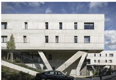
Le soulèvement d'une partie de la barrette de logements par des poteaux obliques allège la masse bâtie.