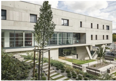
Façade ouest côté jardin. La simplicité formelle apparente du bâtiment contraste avec le terrain accidenté sur lequel il se déploie.

Avec deux barrettes de béton parallèles, légèrement décalées et décollées du sol, l'opération de logements signée Agapé architectes marque la transition entre deux bâtis.