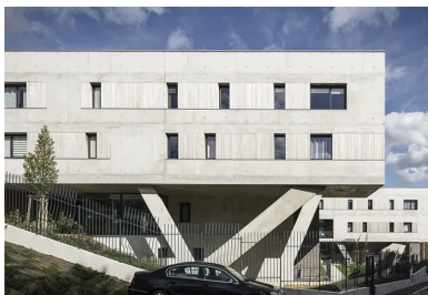
Le soulèvement d'une partie de la barrette de logements par des poteaux obliques allège la masse bâtie.