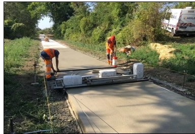
Derrière la toile de jute, la protection du béton est assurée par la pulvérisation d'un produit de cure.

« Le bétonnage a été effectué en grande partie à l'aide d'une machine à coffrages glissants guidée sur fils (deux fils, un fil de chaque côté) et tractant une toile de jute », ajoute Alain Quiévreux.