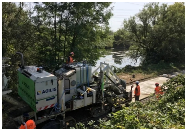
Le nouveau tronçon de la promenade cyclable Fil bleu des Berges de l'Orne en cours de réalisation.