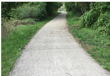
La promenade cyclable en béton s'étire désormais sur 30 km de long.

La communauté de communes Rives de Moselle (57) a inauguré, le 9 octobre 2021, deux nouveaux tronçons, situés entre Richemont et Gandrange, de la piste cyclable du Fil bleu de l'Orne. Totalisant une longueur de 6,5 km, avec une largeur de 2,50 m, ces deux extensions ont été réalisées en 2020 et en 2021 par AGILIS, en groupement avec Muller TP, mandataire pour les terrassements et les préparations. Ces deux filiales du groupe NGE ont collaboré en cotraitance avec Stradest, sous la maîtrise d'œuvre du cabinet BEA. Ces deux projets, conçus avec un revêtement en béton, ont nécessité la fabrication et la livraison de 2 000 m 3 de béton par EQIOM, à partir de ses centrales d'Illange (centrale principale) et de Metz-Borny (centrale de secours).