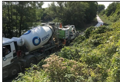
Le béton fabriqué à la centrale d'Illange d'EQIOM est livré par camions-toupies devant la machine à coffrages glissants.

Le bétonnage a été conduit de façon mécanisée. En effet, sur la majeure partie du tracé entre les communes de Richemont et de Gandrange, une machine à coffrages glissants équipée d'un moule de type « chaussée » a été utilisée. Les endroits les moins accessibles (d'une largeur insuffisante pour le passage de la machine), qui représentaient 5 % du linéaire, ont été traités de façon manuelle. Dans ce cas, le bétonnage a été réalisé entre coffrages fixes et le béton de formulation spécifique ( consistance S3 ) a été tiré manuellement à la régle vibrante .