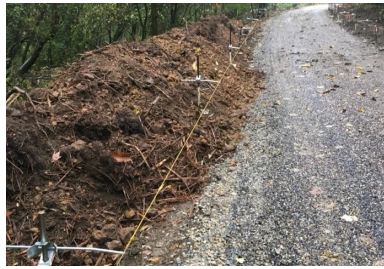
Couche de forme avec enduit de protection prête à recevoir le revêtement en béton. Fils de guidage de la machine à coffrages glissants déjà en place.

Le béton a été fabriqué et livré par EQIOM, à partir de sa centrale BPE d'Illange. Le béton a été ensuite acheminé depuis la centrale jusqu'au chantier par camions-toupies, qui déversent le béton devant la machine à coffrages glissants. « Le chantier a parfois nécessité l'emploi d'une pompe ou même d'un girabenne pour parvenir à alimenter, dans de bonnes conditions, la machine à coffrages glissants », précise Alain Quiévreux, conducteur de travaux chez AGILIS.