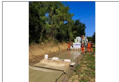
La machine à coffrages glissants, tractant la toile de jute, assure simultanément la réalisation du revêtement en béton et le traitement de surface.