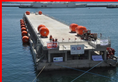
Le ponton flottant dispose de deux ponts superposés. Le pont supérieur est dégagé de toute servitude technique pour rester accessible en permanence aux opérations de chargement/déchargement.