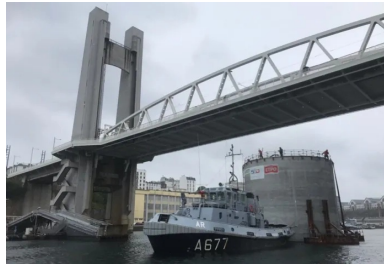
Passage du convoi du musoir sous le célèbre pont de Recouvrance. Afin de pouvoir passer le seuil du bassin n° 4, le musoir a été flanqué de flotteurs additionnels durant le remorquage, ce qui limite son tirant d'eau.

La réalisation du musoir, cylindre de 14 m de diamètre et 23 m de haut, a été menée parallèlement à celle du ponton. Après le coulage du radier de 80 cm d'épaisseur, ses voiles courbes de 40 cm d'épaisseur en partie courante ont été coulés à l'aide d'un coffrage glissant sur six jours en continu, au rythme de 20 cm par heure. « Cette opération intensive, menée par 40 personnes mobilisées 24 h/24, a été minutieusement préparée en amont, notamment pour assurer le bon cadencement des camions-toupies, qui devaient livrer 4 m 3 /heure. »