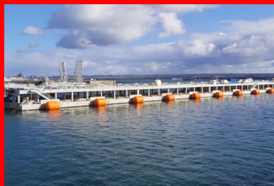
Vue générale du ponton flottant, de la passerelle métallique de liaison au quai (à gauche) et du musoir (à droite), qui constitue le point fixe d'accostage et d'amarrage des frégaes côté mer.

La base navale de Brest s'est récemment dotée d'un nouvel appontement pour accueillir les frégaes multi-missions de la Marine nationale. L'ouvrage se distingue par son originalité : il s'agit d'un ponton flottant en béton armé aux dimensions XXL : 160 m de longueur, 17 m de largeur pour 9 m de hauteur. Entre planning serré, logistique contrôlée et hautes exigences de qualité, sa construction, dans une cale sèche de la base militaire, a imposé de relever de nombreux défis au groupement d'entreprises de génie civil. Récit.