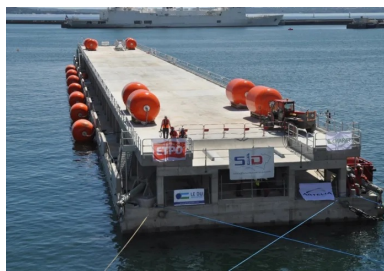
Le ponton flottant dispose de deux ponts superposés. Le pont supérieur est dégagé de toute servitude technique pour rester accessible en permanence aux opérations de chargement/déchargement.