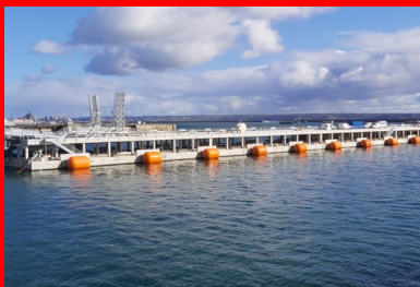
Vue générale du ponton flottant, de la passerelle métallique de liaison au quai (à gauche) et du musoir (à droite), qui constitue le point fixe d'accostage et d'amarrage des frégaes côté mer.

La base navale de Brest s'est récemment dotée d'un nouvel appontement pour accueillir les frégaes multi-missions de la Marine nationale. L'ouvrage se distingue par son originalité : il s'agit d'un ponton flottant en béton armé aux dimensions XXL : 160 m de longueur, 17 m de largeur pour 9 m de hauteur. Entre planning serré, logistique contrôlée et hautes exigences de qualité, sa construction, dans une cale sèche de la base militaire, a imposé de relever de nombreux défis au groupement d'entreprises de génie civil. Récit.