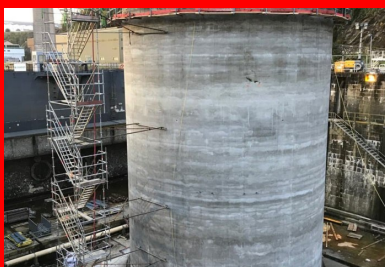
Encastré dans un radier de 80 cm d'épaisseur, le voile circulaire du musoir (40 cm d'épaisseur) a été érigé à l'aide d'un coffrage glissant sur toute sa hauteur (22,2 m). Le coulage du voile a été mis en œuvre en continu sur six jours par une équipe de 40 personnes mobilisées 24 h/24. Cette continuité permettait de limiter les reprises de bétonnage, qui constituent des zones de fragilité, notamment vis-à-vis de l'étanchéité du parement.

Perpendiculaire au quai, le ponton est solidement amarré à chacune de ses extrémités à des points fixes, par l'intermédiaire de chaînes métalliques : côté quai, sur des massifs en béton armé fondés sur des micropieux ; côté mer, sur un musoir cylindrique en béton armé posé sur le fond marin. Sur le ponton, les quatre points d'ancrage de la chaîne sont constitués d'amortisseurs conçus pour reprendre les efforts d'accostage et les efforts d'amarrage. « Lorsque le ponton est chahuté par une mer agitée, les amortisseurs permettent de réduire les efforts d'amarrage. Néanmoins, cette réduction suppose qu'eux-mêmes puissent encaisser des charges importantes. C'est pourquoi les amortisseurs sont fixés sur des socles en béton très fortement armé – de l'ordre de 350 kg d'armature par mètre cube de béton, contre une moyenne de 200 kg/m 3 pour le reste de l'ouvrage », précise Emmanuel Starksen, directeur général délégué d'ETPO, cotraitant du groupement de génie civil piloté par l'entreprise Charier.