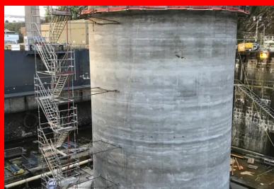
Encastré dans un radier de 80 cm d'épaisseur, le voile circulaire du musoir (40 cm d'épaisseur) a été érigé à l'aide d'un coffrage glissant sur toute sa hauteur (22,2 m). Le coulage du voile a été mis en œuvre en continu sur six jours par une équipe de 40 personnes mobilisées 24 h/24. Cette continuité permettait de limiter les reprises de bétonnage, qui constituent des zones de fragilité, notamment vis-à-vis de l'étanchéité du parement.

Perpendiculaire au quai, le ponton est solidement amarré à chacune de ses extrémités à des points fixes, par l'intermédiaire de chaînes métalliques : côté quai, sur des massifs en béton armé fondés sur des micropieux ; côté mer, sur un musoir cylindrique en béton armé posé sur le fond marin. Sur le ponton, les quatre points d'ancrage de la chaîne sont constitués d'amortisseurs conçus pour reprendre les efforts d'accostage et les efforts d'amarrage. « Lorsque le ponton est chahuté par une mer agitée, les amortisseurs permettent de réduire les efforts d'amarrage. Néanmoins, cette réduction suppose qu'eux-mêmes puissent encaisser des charges importantes. C'est pourquoi les amortisseurs sont fixés sur des socles en béton très fortement armé – de l'ordre de 350 kg d'armature par mètre cube de béton, contre une moyenne de 200 kg/m 3 pour le reste de l'ouvrage », précise Emmanuel Starksen, directeur général délégué d'ETPO, cotraitant du groupement de génie civil piloté par l'entreprise Charier.