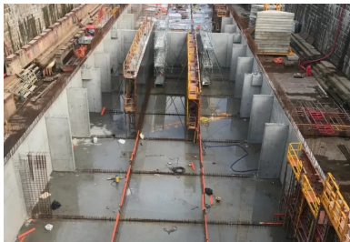
Vue du niveau inférieur du ponton en construction. Les voiles périphériques et le cloisonnement intérieur permettent de créer 12 alvéoles indépendantes garantissant le maintien en flottaison de l'ouvrage en cas d'avarie.

Ces deux ponts - dont la structure en béton armé est constituée de dalles sur poutres et poteaux - reposent sur un caisson flottant monolithique, également en béton armé, dont 3,4 m sont immergés en permanence. Sa structure est constituée d'un radier et de voiles périphériques de forte épaisseur. Pour que le caisson puisse flotter malgré son poids important, un cloisonnement intérieur dessine douze alvéoles indépendantes présentant un volume total de 1 000 m 3 et constituant autant de « poches » d'air à même de contribuer à la poussée d'Archimède.