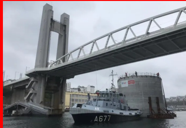
Passage du convoi du musoir sous le célèbre pont de Recouvrance. Afin de pouvoir passer le seuil du bassin n° 4, le musoir a été flanqué de flotteurs additionnels durant le remorquage, ce qui limite son tirant d'eau.

La réalisation du musoir, cylindre de 14 m de diamètre et 23 m de haut, a été menée parallèlement à celle du ponton. Après le coulage du radier de 80 cm d'épaisseur, ses voiles courbes de 40 cm d'épaisseur en partie courante ont été coulés à l'aide d'un coffrage glissant sur six jours en continu, au rythme de 20 cm par heure. « Cette opération intensive, menée par 40 personnes mobilisées 24 h/24, a été minutieusement préparée en amont, notamment pour assurer le bon cadencement des camions-toupies, qui devaient livrer 4 m 3 /heure. »