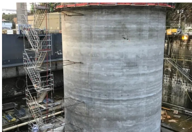
Encastré dans un radier de 80 cm d'épaisseur, le voile circulaire du musoir (40 cm d'épaisseur) a été érigé à l'aide d'un coffrage glissant sur toute sa hauteur (22,2 m). Le coulage du voile a été mis en œuvre en continu sur six jours par une équipe de 40 personnes mobilisées 24 h/24. Cette continuité permettait de limiter les reprises de bétonnage, qui constituent des zones de fragilité, notamment vis-à-vis de l'étanchéité du parement.

Perpendiculaire au quai, le ponton est solidement amarré à chacune de ses extrémités à des points fixes, par l'intermédiaire de chaînes métalliques : côté quai, sur des massifs en béton armé fondés sur des micropieux ; côté mer, sur un musoir cylindrique en béton armé posé sur le fond marin. Sur le ponton, les quatre points d'ancrage de la chaîne sont constitués d'amortisseurs conçus pour reprendre les efforts d'accostage et les efforts d'amarrage. « Lorsque le ponton est chahuté par une mer agitée, les amortisseurs permettent de réduire les efforts d'amarrage. Néanmoins, cette réduction suppose qu'eux-mêmes puissent encaisser des charges importantes. C'est pourquoi les amortisseurs sont fixés sur des socles en béton très fortement armé - de l'ordre de 350 kg d'armature par mètre cube de béton, contre une moyenne de 200 kg/m 3 pour le reste de l'ouvrage », précise Emmanuel Størksen, directeur général délégué d'ETPO, cotraitant du groupement de génie civil piloté par l'entreprise Charier.