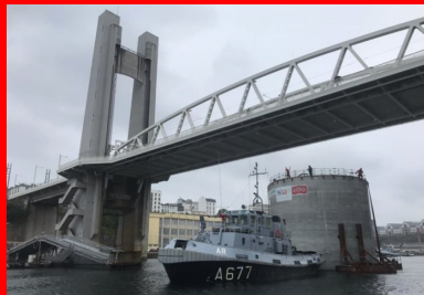
Passage du convoi du musoir sous le célèbre pont de Recouvrance. Afin de pouvoir passer le seuil du bassin n° 4, le musoir a été flanqué de flotteurs additionnels durant le remorquage, ce qui limite son tirant d'eau.

La réalisation du musoir, cylindre de 14 m de diamètre et 23 m de haut, a été menée parallèlement à celle du ponton. Après le coulage du radier de 80 cm d'épaisseur, ses voiles courbes de 40 cm d'épaisseur en partie courante ont été coulés à l'aide d'un coffrage glissant sur six jours en continu, au rythme de 20 cm par heure. « Cette opération intensive, menée par 40 personnes mobilisées 24 h/24, a été minutieusement préparée en amont, notamment pour assurer le bon cadencement des camions-toupies, qui devaient livrer 4 m 3 /heure. »