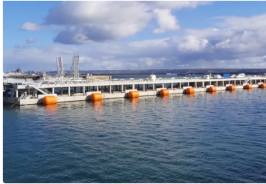
Vue générale du ponton flottant, de la passerelle métallique de liaison au quai (à gauche) et du musoir (à droite), qui constitue le point fixe d'accostage et d'amarrage des frégates côté mer.

La base navale de Brest s'est récemment dotée d'un nouvel apponnement pour accueillir les frégates multi-missions de la Marine nationale . L'ouvrage se distingue par son originalité : il s'agit d'un ponton flottant en béton armé aux dimensions XXL : 160 m de longueur, 17 m de largeur pour 9 m de hauteur . Entre planning serré, logistique contrôlée et hautes exigences de qualité , sa construction, dans une cale sèche de la base militaire, a imposé de relever de nombreux défis au groupement d'entreprises de génie civil. Récit.