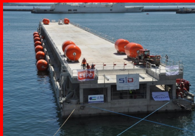
Le ponton flottant dispose de deux ponts superposés. Le pont supérieur est dégagé de toute servitude technique pour rester accessible en permanence aux opérations de chargement/déchargement.