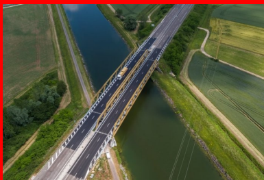
Vue aérienne du viaduc du canal de dérivation de la Saône rénové sur l'A36. L'ouvrage est constitué d'un double tablier mixte de 100 m de long à poutres extradossées de type Warren. Le chantier de réfection de l'étanchéité était soumis à deux contraintes d'exploitation : l'impossibilité de couper la circulation des véhicules sur l'autoroute et des péniches sur le canal.

Sur l'autoroute A36, la réfection de l'étanchéité du viaduc franchissant le canal de dérivation de la Saône a été réalisée en béton fibré à ultra hautes performances (BFUP). Ce matériau très technique, habituellement réservé à des applications structurales, a été préféré aux matériaux et procédés d'étanchéité classiques. Une analyse multicritère tenant compte des spécificités de conception de l'ouvrage et de son environnement a ainsi conduit APRR, exploitant de l'A36, à expérimenter cette solution, inédite en France.