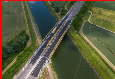
Vue aérienne du viaduc du canal de dérivation de la Saône rénové sur l'A36. L'ouvrage est constitué d'un double tablier mixte de 100 m de long à poutres extradossées de type Warren. Le chantier de réfection de l'étanchéité était soumis à deux contraintes d'exploitation : l'impossibilité de couper la circulation des véhicules sur l'autoroute et des péniches sur le canal.

Sur l'autoroute A36, la réfection de l'étanchéité du viaduc franchissant le canal de dérivation de la Saône a été réalisée en béton fibré à ultra hautes performances (BFUP). Ce matériau très technique, habituellement réservé à des applications structurales, a été préféré aux matériaux et procédés d'étanchéité classiques. Une analyse multicritère tenant compte des spécificités de conception de l'ouvrage et de son environnement a ainsi conduit APRR, exploitant de l'A36, à expérimenter cette solution, inédite en France.