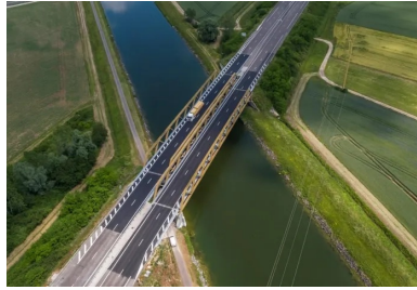
Vue aérienne du viaduc du canal de dérivation de la Saône rénové sur l'A36. L'ouvrage est constitué d'un double tablier mixte de 100 m de long à poutres extradossées de type Warren. Le chantier de réfection de l'étanchéité était soumis à deux contraintes d'exploitation : l'impossibilité de couper la circulation des véhicules sur l'autoroute et des péniches sur le canal.

Sur l'autoroute A36, la réfection de l'étanchéité du viaduc franchissant le canal de dérivation de la Saône a été réalisée en béton fibré à ultra hautes performances (BFUP). Ce matériau très technique, habituellement réservé à des applications structurales, a été préféré aux matériaux et procédés d'étanchéité classiques. Une analyse multicritère tenant compte des spécificités de conception de l'ouvrage et de son environnement a ainsi conduit APRR, exploitant de l'A36, à expérimenter cette solution, inédite en France.