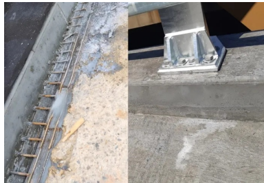
Joint de reprise des longrines. Les armatures (photo de gauche), placées au fond d'une saignée, permettent de connecter le BFUP de la longrine à celui du hourdis. Ce dispositif de couture permet de garantir, par l'intermédiaire d'un recouvrement des BFUP, la parfaite continuité de l'étanchéité (photo de droite).

La bonne réalisation de l'étanchéité BFUP sur l'ouvrage existant passait ainsi par un phasage précis. Tout d'abord, il s'agissait de raboter l'enrobé et l'étanchéité existants. À cette étape de curage succédait celle du surfacage du béton support par hydrodémolition. « L'objectif de cet atelier était de créer une macrorugosité optimale pour assurer l'adhérence à l'interface du BFUP et du béton. Il faut en effet noter que la connexion mécanique entre les deux matériaux n'était pas réalisée par l'intermédiaire de connecteurs, mais par une simple reprise de bétonnage », poursuit Benjamin Simian. Le support était ensuite humidifié à l'aide d'un brumisateuse afin d'améliorer les conditions de prise et d'adhérence du BFUP, coulé en une couche de 3,5 cm d'épaisseur. Enfin, l'enrobé était mis en œuvre sur 5 cm d'épaisseur après hydrodépilage du BFUP et emploi d'un primaire pour améliorer l'adhérence du matériau bitumineux sur le BFUP.