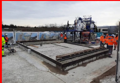
Dalle de convenue après hydrodémolition. Ce modèle réduit de la dalle du pont a été créé pour accompagner le bon déroulement du chantier. Pour valider les performances d'adhérence de l'étanchéité BFUP sur son support béton, des essais destructifs ont été réalisés sur cette dalle. Les résultats sont impressionnants : les éprouvettes ne cassaient pas à l'interface BFUP/béton, mais dans la masse du béton de dalle ! Autrement dit, la couche de BFUP crée un ensemble totalement monolithique avec la dalle existante.

« Forts de ce constat, nous avons alors décidé de reprendre l'intégralité de l'étanchéité de l'ouvrage », poursuit Romain Pittet. Plusieurs solutions ont alors été étudiées. « Nous avons mené une analyse multicritère rigoureuse sur la base des contraintes qui s'imposaient à nous et des objectifs que nous nous étions fixés. » Les contraintes principales étaient au nombre de trois : « Il fallait tout d'abord que nous n'augmentions pas le poids propre de l'ouvrage, sinon nous aurions été obligés de le renforcer. Cela signifiait notamment que nous devions conserver une faible épaisseur d'enrobés. Ensuite, nous devions trouver un procédé qui puisse résister durablement aux fortes chaleurs et à l'effet « radiateur » induit par la conception de l'ouvrage. Enfin, le chantier devait se dérouler dans un délai serré, pour minimiser la gêne à l'usager. » Les objectifs principaux de la rénovation étaient quant à eux les suivants : « Nous voulions que la réfection soit pérenne dans le temps, pour que nous n'ayons pas à y revenir régulièrement. Pour garantir une protection uniforme sur toute la largeur de l'ouvrage, il fallait aussi que l'étanchéité couvre de manière continue le hourdis du tablier et les longrines latérales. »