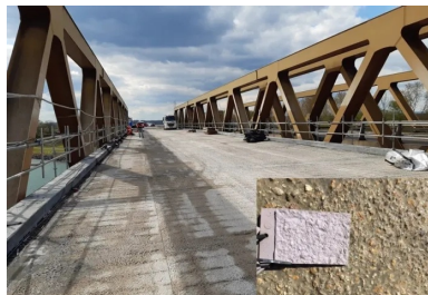
Préparation du support béton. La dalle béton support est soigneusement préparée par hydrodémolition avant le coulage du BFUP. Ce traitement assure une macro et une micro rugosité optimales pour que le BFUP puisse créer des liaisons chimiques suffisamment fortes avec le béton existant. Le niveau de rugosité est contrôlé visuellement à l'aide de petites plaques étalons (système ICRI) reproduisant la rugosité à atteindre (photo en bas à droite).

(2) Les trois normes BFUP françaises sont les normes NF P 18-451, NF P 18-470 et NF P 18-710