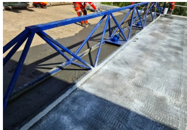
Coulage de la couche d'étanchéité BFUP du tablier. Une fois coulé sur le support béton humecté, le BFUP est légèrement vibré à l'aide d'une règle vibrante. Cette opération permet d'étaler le matériau et de fixer son épaisseur selon une pente transversale de 2 %. Une fois mis en œuvre, le BFUP est immédiatement traité avec un produit de cure puis recouvert d'un géotextile. Celui-ci est maintenu humide pendant quatre jours, afin de garantir une prise homogène du BFUP.