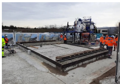
Dalle de convenance après hydrodémolition. Ce modèle réduit de la dalle du pont a été créé pour accompagner le bon déroulement du chantier. Pour valider les performances d'adhérence de l'étanchéité BFUP sur son support béton, des essais destructifs ont été réalisés sur cette dalle. Les résultats sont impressionnants : les éprouvettes ne cassaient pas à l'interface BFUP/béton, mais dans la masse du béton de dalle ! Autrement dit, la couche de BFUP crée un ensemble totalement monolithique avec la dalle existante.

« Forts de ce constat, nous avons alors décidé de reprendre l'intégralité de l'étanchéité de l'ouvrage », poursuit Romain Pittet. Plusieurs solutions ont alors été étudiées. « Nous avons mené une analyse multicritère rigoureuse sur la base des contraintes qui s'imposaient à nous et des objectifs que nous nous étions fixés. » Les contraintes principales étaient au nombre de trois : « Il fallait tout d'abord que nous n'augmentions pas le poids propre de l'ouvrage, sinon nous aurions été obligés de le renforcer. Cela signifiait notamment que nous devions conserver une faible épaisseur d'enrobés. Ensuite, nous devions trouver un procédé qui puisse résister durablement aux fortes chaleurs et à l'effet « radiateur » induit par la conception de l'ouvrage. Enfin, le chantier devait se dérouler dans un délai serré, pour minimiser la gêne à l'usager. » Les objectifs principaux de la rénovation étaient quant à eux les suivants : « Nous voulions que la réfection soit pérenne dans le temps, pour que nous n'ayons pas à y revenir régulièrement. Pour garantir une protection uniforme sur toute la largeur de l'ouvrage, il fallait aussi que l'étanchéité couvre de manière continue le hourdis du tablier et les longrines latérales. »