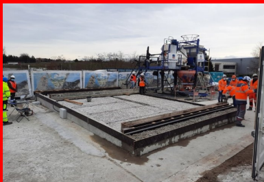
Dalle de convenance après hydrodémolition. Ce modèle réduit de la dalle du pont a été créé pour accompagner le bon déroulement du chantier. Pour valider les performances d'adhérence de l'étanchéité BFUP sur son support béton, des essais destructifs ont été réalisés sur cette dalle. Les résultats sont impressionnants : les éprouvettes ne cassaient pas à l'interface BFUP/béton, mais dans la masse du béton de dalle ! Autrement dit, la couche de BFUP crée un ensemble totalement monolithique avec la dalle existante.

« Forts de ce constat, nous avons alors décidé de reprendre l'intégralité de l'étanchéité de l'ouvrage », poursuit Romain Pittet. Plusieurs solutions ont alors été étudiées. « Nous avons mené une analyse multicritère rigoureuse sur la base des contraintes qui s'imposaient à nous et des objectifs que nous nous étions fixés. » Les contraintes principales étaient au nombre de trois : « Il fallait tout d'abord que nous n'augmentions pas le poids propre de l'ouvrage, sinon nous aurions été obligés de le renforcer. Cela signifiait notamment que nous devions conserver une faible épaisseur d'énrobés. Ensuite, nous devions trouver un procédé qui puisse résister durablement aux fortes chaleurs et à l'effet « radiateur » induit par la conception de l'ouvrage. Enfin, le chantier devait se dérouler dans un délai serré, pour minimiser la gêne à l'usager. » Les objectifs principaux de la rénovation étaient quant à eux les suivants : « Nous voulions que la réfection soit pérenne dans le temps, pour que nous n'ayons pas à y revenir régulièrement. Pour garantir une protection uniforme sur toute la largeur de l'ouvrage, il fallait aussi que l'étanchéité couvre de manière continue le hourdis du tablier et les longrines latérales. »