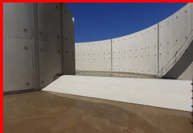
Les bétons des bassins de la station d'épuration sont formulés pour pouvoir résister aux attaques chimiques des effluents en cours de traitement.

Les travaux d'extension de la station d'épuration de Breuil-le-Vert (Oise) comprennent la construction d'une nouvelle filière de traitement des eaux usées. Les trois bassins principaux nécessaires au fonctionnement du process sont conçus pour résister aux effluents chimiques les plus agressifs. À cet effet, ces ouvrages structurels parfaitement étanches sont constitués d'un béton spécialement formulé.