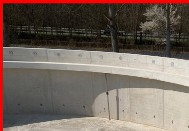
Les radiers de chaque bassin ont été coulés en une fois, ils sont fondés sur des pieux en béton de grande capacité portante, réalisés selon la technique du refoulement de type INSER ® .

Dans le détail, le principe de réalisation du pieu à refoulement est le suivant : le forage est d'abord effectué jusqu'à la profondeur finale à atteindre. Puis, le béton est pompé par l'âme centrale de l'outil tandis que l'outil est remonté : le béton occupe alors l'empreinte cylindrique laissée par l'outil tout au long du mouvement ascendant. « Les avantages principaux de ce procédé de fondations profondes sont au nombre de trois : la mise en œuvre est très rapide, il permet de ne pas surconsommer de béton, et la faible quantité de déblais produite limite les coûts d'évacuation », synthétise Alain Dangletterre.