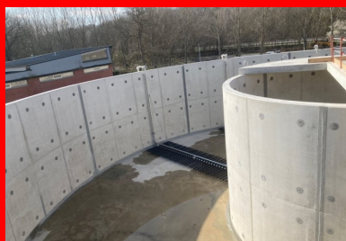
Les voiles des bassins ont été réalisés à l'aide d'un outil coffrant circulaire fabriqué sur mesure. Les rayons de courbure de chacun des bassins étant différents, le coffrage était réglé pour épouser précisément les courbes.

Le programme du chantier de génie civil, d'une durée de 18 mois, comporte notamment la construction des trois bassins principaux en béton armé de la nouvelle filière : un bassin d'aération de 6 m de haut et 28 m de diamètre, un bassin clarificateur de 3,5 m de haut et 21 m de diamètre, et un silo de stockage des boues de 4,5 m de hauteur et 11,5 m de diamètre.