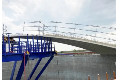
Chaque pétale est équipé de garde-corps de chantier avant d'être positionné sur l'outil-parapluie.