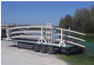
Les racks de transport mis au point par Demathieu Bard permettent de superposer trois pétales.

Les digesteurs sont des enceintes fermées, privées d'oxygène, maintenues à une température de 55 °C et brassées pour maintenir des conditions favorables au développement de micro-organismes. Plusieurs populations bactériennes se développent et transforment les substrats organiques complexes à longues chaînes carbonées en molécules simples : méthane (CH 4 ) et dioxyde de carbone (CO 2 ). Le biogaz ainsi produit est collecté dans la partie haute des digesteurs puis évacué sous une pression de 20 mbars vers les gazomètres. Il est acheminé jusqu'au sein d'un bâtiment de compression où il est stocké avant d'être redistribué vers les installations de combustion.