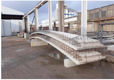
Pour réaliser les 638 pétales qui couvrent les 11 digesteurs, la préfabrication a été privilégiée.

Située dans les Yvelines, la station d'épuration Seine Aval d'Achères traite 60 % des effluents de l'agglomération parisienne. La dépollution des eaux usées génère des boues d'épuration (400 g de boues par mètre cube d'eau traitée). Principalement constituées d'éléments minéraux et organiques (phosphore, azote et carbone), ces boues sont revalorisées et utilisées soit en fertilisants agricoles (60 % des volumes), soit en remblai de construction, soit transférées dans des digesteurs anaérobiques thermophiles qui les transforment en combustible « vert » : le biogaz.