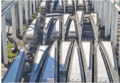
Stockage des « pétales » dans l'usine Capremib, filiale de Demathieu Bard spécialisée dans la préfabrication.

Située dans les Yvelines, la station d'épuration Seine Aval d'Achères traite 60 % des effluents de l'agglomération parisienne. La dépollution des eaux usées génère des boues d'épuration (400 g de boues par mètre cube d'eau traitée). Principalement constituées d'éléments minéraux et organiques (phosphore, azote et carbone), ces boues sont revalorisées et utilisées soit en fertilisants agricoles (60 % des volumes), soit en remblai de construction, soit transférées dans des digesteurs anaérobiques thermophiles qui les transforment en combustible « vert » : le biogaz.