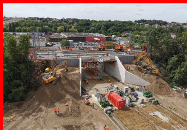
Une fois le pont-rail dans sa position définitive, la plateforme ferroviaire, déjà préchargée sur l'ouvrage (ballast et panneaux de voies), a été raccordée aux plateformes en attente de part et d'autre de la brèche. Parallèlement, les derniers remblaiements latéraux ont été effectués. Finalement, l'OCP s'est achevée avec une heure d'avance sur le planning !

La totalité des bétons des structures, provisoires ou définitives, a été réalisée avec une formulation unique répondant aux normes et prescriptions très strictes imposées par SNCF Réseau. Il s'agit d'un béton de classe de résistance C35/45 résistant aux sels de déverglaçage (classe d'exposition XD3), formulé à base d'un ciment de type CEM III. « Ce type de ciment, qui contient une plus faible proportion de clinker, limite la montée en température au cœur du matériau lors de la prise du béton. Cela permet de maîtriser les risques d'apparition des réactions sulfatiques internes, qui peuvent créer à terme des désordres structurels », détaille Ludovic Ayma. Afin d'éviter une autre pathologie potentielle du béton, le phénomène d'alcali-réaction, les granulats du béton ont par ailleurs été sélectionnés à l'issue d'études en amont afin de limiter la présence de silice réactive.