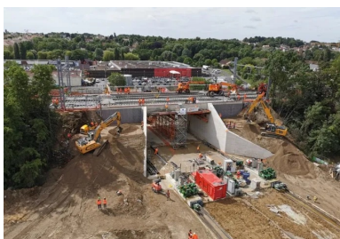
Une fois le pont-rail dans sa position définitive, la plateforme ferroviaire, déjà préchargée sur l'ouvrage (ballast et panneaux de voies), a été raccordée aux plateformes en attente de part et d'autre de la brèche. Parallèlement, les derniers remblaiements latéraux ont été effectués. Finalement, l'OCP s'est achevée avec une heure d'avance sur le planning !

La totalité des bétons des structures, provisoires ou définitives, a été réalisée avec une formulation unique répondant aux normes et prescriptions très strictes imposées par SNCF Réseau. Il s'agit d'un béton de classe de résistance C35/45 résistant aux sels de déverglaçage (classe d'exposition XD3), formulé à base d'un ciment de type CEM III. « Ce type de ciment, qui contient une plus faible proportion de clinker, limite la montée en température au cœur du matériau lors de la prise du béton. Cela permet de maîtriser les risques d'apparition des réactions sulfatiques internes, qui peuvent créer en terme des désordres structurels », détaille Ludovic Ayma. Afin d'éviter une autre pathologie potentielle du béton, le phénomène d'alcali-réaction, les granulats du béton ont par ailleurs été sélectionnés à l'issue d'études en amont afin de limiter la présence de silice réactive.