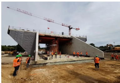
Une fois la brèche créée dans le remblai ferroviaire, le parcours de ripage a été scalpé à la bonne cote, afin de permettre à l'ouvrage de glisser sans effort excessif. Le ripage proprement dit a alors pu se dérouler : huit heures ont été nécessaires pour faire parcourir au pont-rail de quelque 6 500 tonnes les 49 mètres qui le séparent de son emplacement définitif.