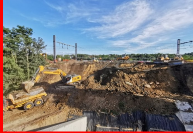
L'une des premières actions de l'opération coup de poing (OCP) a consisté à créer dans le remblai ferroviaire la brèche nécessaire à l'insertion du pont-rail. 13 000 m 3 de terre ont ainsi été déblayés en 24 heures.

Ce coulage stratégique a, par chance, été réalisé deux jours avant le premier confinement : « Le 17 mars au matin, nous fermions le chantier pour un mois complet. Mi-avril, lorsque nous avons repris, nous devions absolument rattraper le retard – et réaliser les travaux en un mois au lieu de deux – car les dates du ripage n'étaient pas déplaçables ! » C'est ainsi que l'entreprise a dû mettre les bouchées doubles. Le chantier a repris sur deux postes, y compris les samedis et jours fériés. Pour gagner du temps, plusieurs modifications méthodologiques ont été proposées à SNCF Réseau. Ainsi, les murs de fermeture des travées d'approche (10 m par 10 m) devaient initialement être coulés en place. « Pour gagner du temps, nous avons projeté du béton par voie sèche à prise rapide agréé par la direction de l'ingénierie de la SNCF. » Ce procédé sans coffrage, habituellement mis en œuvre pour les soutènements ferroviaires provisoires ou définitifs, permettait d'obtenir des résistances à la compression très importantes dès 8 heures de prise. « Par ce choix, nous avons gagné deux semaines de travail », assure Ludovic Ayma. Et terminé l'ouvrage à temps pour l'OCP.