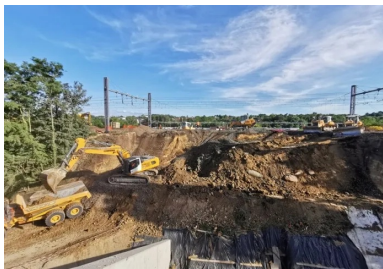
L'une des premières actions de l'opération coup de poing (OCP) a consisté à créer dans le remblai ferroviaire la brèche nécessaire à l'insertion du pont-rail. 13 000 m 3 de terre ont ainsi été déblayés en 24 heures.