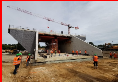
Une fois la brèche créée dans le remblai ferroviaire, le parcours de ripage a été scalpé à la bonne cote, afin de permettre à l'ouvrage de glisser sans effort excessif. Le ripage proprement dit a alors pu se dérouler : huit heures ont été nécessaires pour faire parcourir au pont-rail de quelque 6 500 tonnes les 49 mètres qui le séparaient de son emplacement définitif.