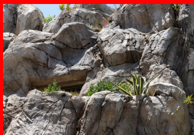
Les failles et les cavités avec leurs poches de plantations variées, propices à la réinstallation de la faune et de la flore locales.

Au rez-de-chaussée haut, on accède à la maison de plain-pied par une faille dans le rocher. La référence à l'univers des grottes est d'autant plus évidente qu'une autre grande faille se développe sur toute la hauteur des 5 niveaux. Reliant les pièces entre elles, elle filtre la lumière.