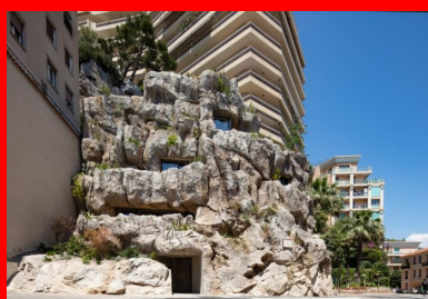
Les formes dessinées et sculptées, une patine en harmonie avec la roche existante et la végétation recréée sont totalement fidèles à l'image et à la puissance d'un rocher naturel.

Œuvre commune d'un architecte qui aime les « choses complexes et claires » et d'une entreprise désireuse d'exposer sa maîtrise des ouvrages d'exception, la villa troglodyte relève d'une réflexion spatiale, structurelle et paysagère et d'une gestion économique de l'énergie auxquelles les performances thermiques du béton contribuent. Par sa valeur de laboratoire sur un site très complexe et face aux impératifs du réchauffement climatique, elle ouvre des pistes pour l'habitat de demain en répondant aux enjeux environnementaux actuels et en exploitant les énergies naturelles, la géothermie, l'énergie solaire et la récupération d'eau de pluie.