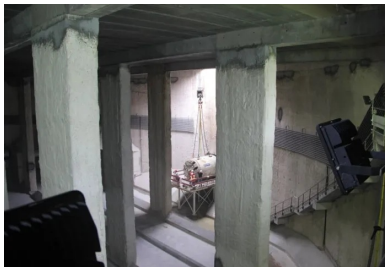
Sortie du micro-tunnelier dans le bassin