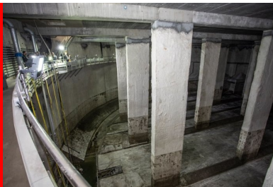
Après avoir réalisé le bétonnage de la paroi moulée du bassin, 22 « poteaux-barrettes » ont été coulés sur lesquels vont se poser les poutres préfabriquées en béton qui supportent la couverture