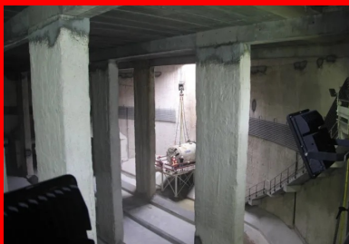
Sortie du micro-tunnelier dans le bassin