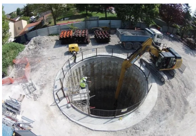
Réalisation du collecteur d'eaux pluviales par microtunnelage, vue du puits de poussée P1

Destiné à lutter contre les inondations et à maîtriser les rejets d'eaux pluviales polluées dans certains cours d'eau, le bassin du Rouailler à Livry-Gargan va également permettre la « baignabilité » du canal de l'Ourcq et de la Seine en vue des Jeux olympiques de 2024.