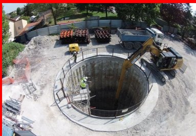
Réalisation du collecteur d'eaux pluviales par microtunnelage, vue du puits de poussée P1

Destiné à lutter contre les inondations et à maîtriser les rejets d'eaux pluviales polluées dans certains cours d'eau, le bassin du Rouailler à Livry-Gargan va également permettre la « baignabilité » du canal de l'Ourcq et de la Seine en vue des Jeux olympiques de 2024.