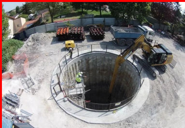
Réalisation du collecteur d'eaux pluviales par microtunnelage, vue du puits de poussée P1

Destiné à lutter contre les inondations et à maîtriser les rejets d'eaux pluviales polluées dans certains cours d'eau, le bassin du Rouailler à Livry-Gargan va également permettre la « baignabilité » du canal de l'Ourcq et de la Seine en vue des Jeux olympiques de 2024.