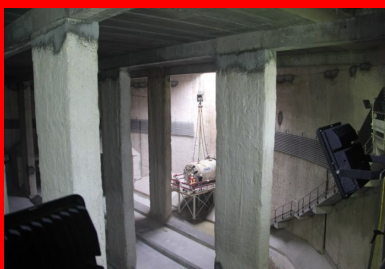
Sortie du micro-tunnelier dans le bassin