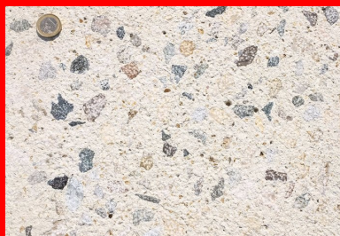
Avec son allure de granit fraîchement coupé, le béton bouchardé est souvent utilisé pour la voirie légère. Il nécessite l'utilisation d'une bouchardeuse.

Pour un chantier urbain d'ampleur, tel que celui de l'aménagement du centre-ville de Blois, le traitement de surface retenu a été le bouchardage (Cf. Schéma 1 - Partie droite).