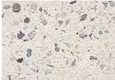
Avec son allure de granit fraîchement coupé, le béton bouchardé est souvent utilisé pour la voirie légère. Il nécessite l'utilisation d'une bouchardeuse.

Plusieurs techniques de traitement de surface existent : désactivation, bouchardage, béton imprimé , hydrosablage, etc. Pour un chantier urbain d'ampleur, tel que celui de l'aménagement du centre-ville de Blois, le traitement de surface retenu a été le bouchardage (Cf. Schéma 1 - Partie droite).