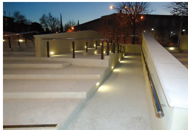
Parvis de l'hôtel de ville de Sorgues (Vaucluse). Matériaux utilisés : béton bouchardé sur base de ciment blanc, sable de Bellegarde, semi-concassé 11/22,4 Vergèze, concassé 14/20 « La Môle ». Maître d'ouvrage : municipalité de Sorgues. Architecte-concepteur : M. Trouvé, cabinet A et Co.

Le choix de la dureté, de la taille et de la couleur des granulats est essentiel pour assurer la qualité du rendu.