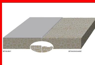
Illustration de la surface du béton avant et après le bouchardage.

Voirie légère, voirie circulée, voirie piétonne et piste cyclable.