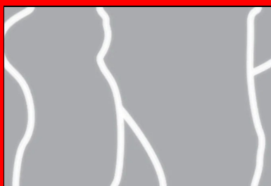
Schéma illustrant le comportement d'un revêtement en béton exécuté sans armatures longitudinales et sans joints de retrait transversaux. Conséquences : fissuration large, anarchique et aléatoire.

Une des méthodes, destinées à contrôler cette fissuration, consiste à utiliser des armatures longitudinales, continues et placées à un certain niveau au sein du revêtement en béton (Cf. Figure 2). Cette technique porte le nom de Béton Armé Continu BAC.