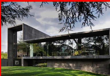
L'enchaînement continu des plans horizontaux et verticaux en béton noir dessine la figure, façonne la volumétrie générale et la spatialité intérieure.

Le béton noir, teinté dans la masse et brut de décoffrage, façonne la volumétrie générale et la spatialité intérieure du nouveau siège de l'agence de Pierre Minassian.