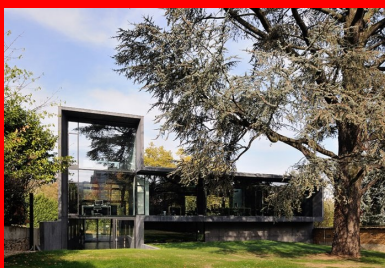
Vue de la façade sud ouverte sur le jardin dominé par un majestueux cèdre du Liban.

L'environnement bâti est aujourd'hui essentiellement résidentiel, constitué majoritairement de maisons individuelles et de quelques petits immeubles collectifs. Ce paysage est appelé à se transformer radicalement à moyen et long termes pour devenir une zone d'activité tertiaire. Avant les travaux, le terrain se présentait sous la forme d'une friche laissée à l'abandon où régnaient une végétation sauvage dominée par un magnifique cèdre du Liban. Il est bordé par la voie ferrée du tram-train au sud et le boulevard du Valvert au nord. Cette voie à grande circulation est appelée à être enterrée, dans le cadre du bouclage du périphérique projeté entre Tassin-la-Demi-Lune et Saint-Fons. Son emprise sera alors aménagée en parc urbain. « Je voulais un bâtiment très simple et iconique de notre architecture », commente Pierre Minassian. « Le bâtiment projeté, par sa volumétrie et sa transparence, est une transition entre l'univers minéral de l'espace urbain au nord et le jardin au sud. Il est conçu comme un signal dans la ville et l'aboutissement d'une forme génératrice d'espaces et d'usages. C'est une sculpture monolithique dans laquelle les matériaux prennent, de par leur mise en œuvre, une valeur esthétique forte qui respecte l'intégrité de la conception architecturale. Le béton noir, teinté dans la masse et laissé brut de décoffrage, est présent sur toutes les faces de la construction. »