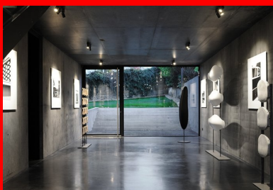
Au rez-de-chaussée du hall, une salle d'exposition accueille les visiteurs.

L'entrée dans l'agence se fait par le volume vertical, qui se dresse au bord de la limite mitoyenne ouest du terrain. Elle donne sur un espace traversant et ouvert sur trois étages, qui fait le lien entre la rue et le jardin. Au rez-de-chaussée, une salle d'exposition accueille les visiteurs. Des photographies de réalisations, des maquettes, des prototypes et des morceaux de façades y sont présentés. Elle peut également recevoir des activités culturelles telles que des manifestations musicales et artistiques diverses. Une porte latérale donne accès aux locaux techniques, aux archives, à la salle de détente et de repas du personnel. Un escalier aérien invite à monter. Il se déploie dans le vide toute hauteur que domine une grande sculpture organique en acier. Suspendue en lévitation dans le vide, « elle représente l'artère de la construction, la circulation verticale et la vie dans l'agence », précise l'architecte.