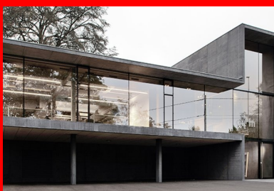
Vue de la façade sur rue.

Deux volumes rectangulaires, l'un vertical sur trois niveaux et l'autre horizontal au premier étage caractérisent l'architecture de l'édifice. Ils composent une figure en T couchée sur le côté, lisible en façades nord et sud. L'enchaînement continu des plans horizontaux et verticaux dessine la figure, façonne la volumétrie générale et la spatialité intérieure. De vastes baies vitrées viennent clore les espaces intérieurs enveloppés dans ce ruban de béton, installant ainsi la transparence voulue par l'architecte. Sous le volume horizontal, le rez-de-chaussée vient en retrait. Côté rue, cela permet d'aménager des places de stationnement protégées. Sur le jardin, le retrait est moins important. De part et d'autre, la mise en lévitation de l'espace de travail souligne sa totale ouverture sur l'extérieur.