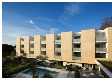
Le rythme des façades en béton alterne avec celui des loggias.