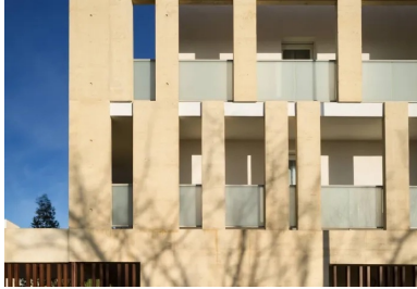
Les façades en béton matricé participent de la structure tout en isolant les loggias aménagées dans le volume général des immeubles.