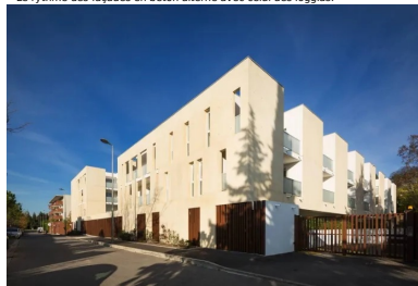
une architecture puissante, travaillée en creux, qui s'impose sous le soleil méditerranéen.