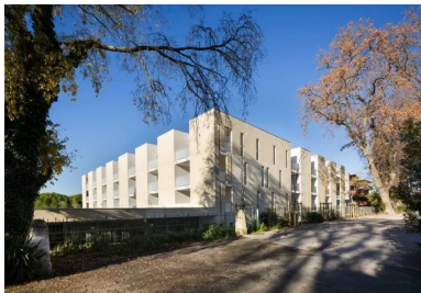
une architecture puissante, travaillée en creux, qui s'impose sous le soleil méditerranéen.