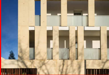
Les façades en béton matricé participent de la structure tout en isolant les loges aménagées dans le volume général des immeubles.