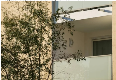
Les façades en béton sont coulées en place dans des matrices de type « travertin ».