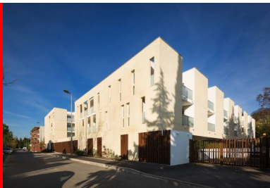
une architecture puissante, travaillée en creux, qui s'impose sous le soleil méditerranéen.