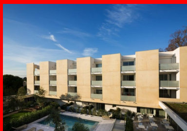
Le rythme des façades en béton alterne avec celui des loggias.