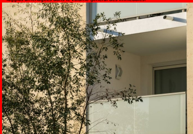
Les façades en béton sont coulées en place dans des matrices de type « travertin ».