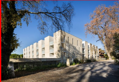
une architecture puissante, travaillée en creux, qui s'impose sous le soleil méditerranéen.