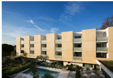
Le rythme des façades en béton alterne avec celui des loggias.