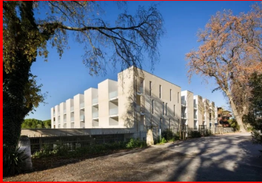
une architecture puissante, travaillée en creux, qui s'impose sous le soleil méditerranéen.