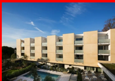
Le rythme des façades en béton alterne avec celui des loggias.