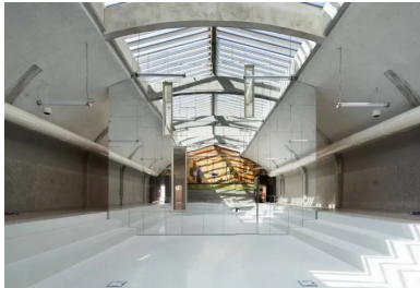
S'élevant dans la hauteur de l'ancienne piscine, le grand mur en inox dilate l'espace.