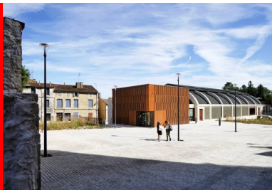
Le parvis de la médiathèque. Le cube du volume d'accueil en extension du bâtiment d'origine.