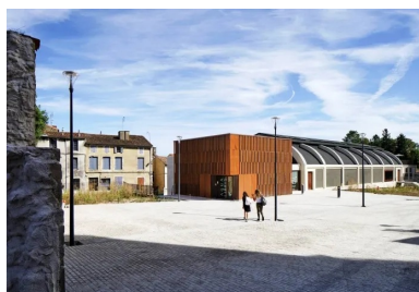
Le parvis de la médiathèque. Le cube du volume d'accueil en extension du bâtiment d'origine.

Par sa structure en béton armé suspendue avec sa voûte mince, le bâtiment d'origine est représentatif de l'architecture industrielle du début du XXe siècle. Il appartient à l'histoire des grandes coques paraboliques utilisées pour les hangars et témoigne d'un savoir-faire technique qui s'est développé à l'époque. Sa rénovation et sa transformation pour de nouveaux usages offrent l'occasion de révaloriser ce patrimoine existant en lui donnant une nouvelle vie. Loin d'être extravagant, l'investissement consenti pour réaliser cette métamorphose, soutenue par la région comme le département, s'inscrit dans une démarche respectueuse de l'environnement humain et urbain. Ainsi, la nouvelle médiathèque est l'occasion pour les habitants de s'approprier en douceur un équipement qui, jusque-là, leur échappait. Elle pourrait aussi symboliser un début de revitalisation de la ville et des communes alentour.