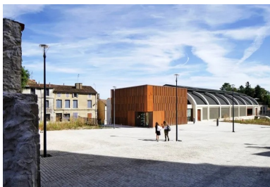
Le parvis de la médiathèque. Le cube du volume d'accueil en extension du bâtiment d'origine.

Par sa structure en béton armé suspendue avec sa voûte mince, le bâtiment d'origine est représentatif de l'architecture industrielle du début du XXe siècle. Il appartient à l'histoire des grandes coques paraboliques utilisées pour les hangars et témoigne d'un savoir-faire technique qui s'est développé à l'époque. Sa rénovation et sa transformation pour de nouveaux usages offrent l'occasion de revaloriser ce patrimoine existant en lui donnant une nouvelle vie. Loin d'être extravagant, l'investissement consenti pour réaliser cette métamorphose, soutenue par la région comme le département, s'inscrit dans une démarche respectueuse de l'environnement humain et urbain. Ainsi, la nouvelle médiathèque est l'occasion pour les habitants de s'approprier en douceur un équipement qui, jusque-là, leur échappait. Elle pourrait aussi symboliser un début de revitalisation de la ville et des communes alentour.