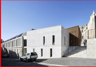
Depuis la rue basse, le nouveau volume en béton blanc brut qui abrite les bureaux de la médiathèque.