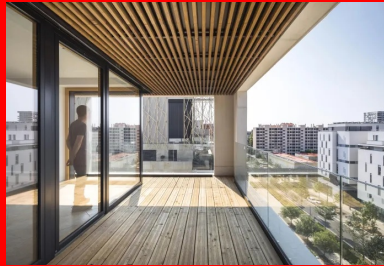
Des loggias profondes sont autant de prolongements extérieurs pour les appartements.