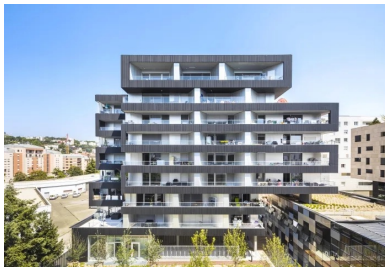
Les logements sociaux et leurs rubans de béton lasuré noir.

Le bâtiment à vocation sociale est entièrement liaisonné par un jeu de lanières horizontales en béton préfabriqué lasuré noir qui s'enroulent en dessinant des terrasses en façade nord, vers la place et son jardin, et des loggias. Sa façade double peau est composée d'un voile structurel en béton coulé en place qui intègre l'isolation par l'extérieur, une lame d'air et les panneaux d'habillage en béton préfabriqué matricié recouverts d'une lasure noire. Les dispositifs de volets et d'occultation ont été incorporés dans l'épaisseur de la double peau.