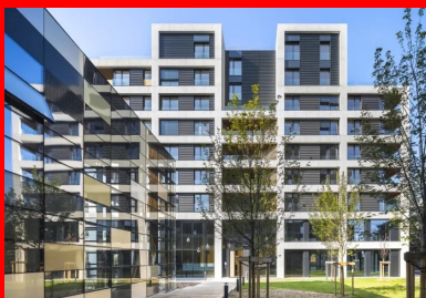
Les logements sociaux et leurs rubans de béton lasuré noir.

Légèrement décalés, les deux bâtiments se font face autour d'un grand jardin central relié à l'espace public du quartier. Ils se caractérisent par deux écritures que les architectes ont délibérément choisi de bien différencier pour instaurer une diversité dans l'ambiance de ce petit brin de ville. En bordure nord-est, un troisième petit volume réservé aux activités commerciales vient parachèvement l'ensemble en créant un porche urbain. Il est complété au sud par une serre-atelier que les habitants du quartier sont invités à investir pour des activités collectives ou associatives en lien avec les potagers familiaux occupant le toit du bâtiment nord.