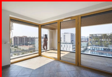
Un « + » pour les habitants lorsqu'ils passent d'une pièce à l'autre par l'extérieur.

Déjà convaincants aujourd'hui quand on compare cet îlot avec ses voisins, le dispositif des « façades nobles » en pignon, l'épannelage, la fragmentation du programme, le principe des vues mises en place deviendront encore plus éloquentes d'ici quelques années, quand le site de la caserne voisine sera remanié.