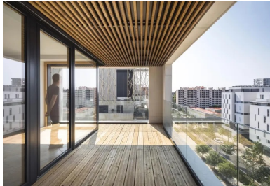
Des loggias profondes sont autant de prolongements extérieurs pour les appartements.