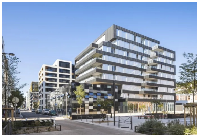
Les trois bâtiments du site dessinent un petit pôle urbain.