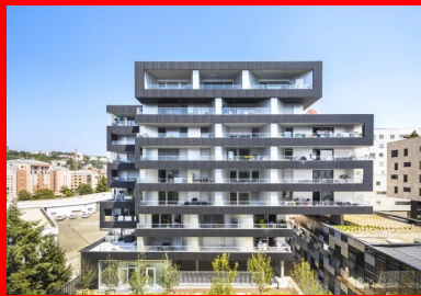
Les logements sociaux et leurs rubans de béton lasuré noir.

au bâtiment son rythme vertical. Le soin apporté aux joints déportés et aux reprises de coulage horizontales contribue à la qualité des finitions et l'absence de trous d'écarteurs de banches accentue l'effet de masse.