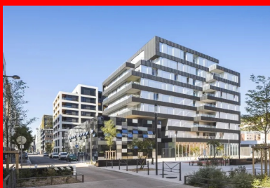
Les trois bâtiments du site dessinent un petit pôle urbain.