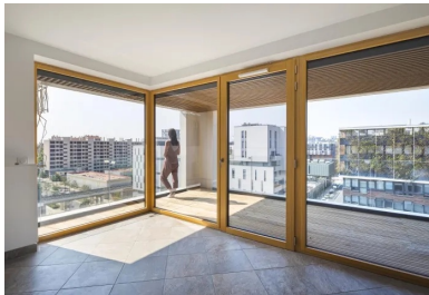
Un « + » pour les habitants lorsqu'ils passent d'une pièce à l'autre par l'extérieur.

Déjà convaincants aujourd'hui quand on compare cet îlot avec ses voisins, le dispositif des « façades nobles » en pignon, l'épannelage, la fragmentation du programme, le principe des vues mises en place deviendront encore plus éloquentes d'ici quelques années, quand le site de la caserne voisine sera remanié.