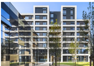
Les logements sociaux et leurs rubans de béton lasuré noir.

Légèrement décalés, les deux bâtiments se font face autour d'un grand jardin central relié à l'espace public du quartier. Ils se caractérisent par deux écritures que les architectes ont délibérément choisi de bien différencier pour instaurer une diversité dans l'ambiance de ce petit brin de ville. En bordure nord-est, un troisième petit volume réservé aux activités commerciales vient parachèvement l'ensemble en créant un porche urbain. Il est complété au sud par une serre-atelier que les habitants du quartier sont invités à investir pour des activités collectives ou associatives en lien avec les potagers familiaux occupant le toit du bâtiment nord.