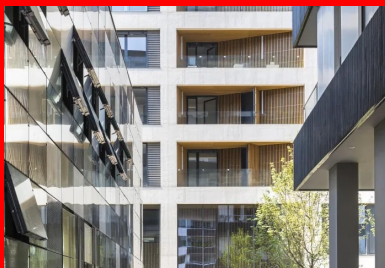
Passage urbain entre les trois bâtiments du site.

Elle permet aussi de créer en façades est, ouest et sud de grandes loggias de plus de 2,40 m de profondeur communes à toutes les pièces du logement, ce dont beaucoup d'habitants se félicitent. « Au quotidien, passer d'une pièce à l'autre et d'une façade à l'autre par l'extérieur en profitant de ces loggias bi-orientées ajoute à l'indéniable qualité d'usage de cet immeuble et au plaisir de vivre ici », témoigne l'un des occupants d'un logement d'angle qui nous a conviés à une visite. Il est de fait qu'à l'intérieur des appartements, ces grandes loggias et leurs embrasures élargissent le champ visuel vers les vues extérieures tout en préservant l'intimité.