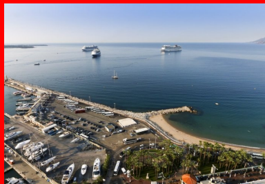
Les digues du Vieux-Port de Cannes se divisent en plusieurs sections.