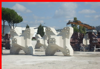
Les ACCROPODE (TM) Il sont des blocs en béton coulés en une fois dans des moules spécifiques. Ils sont dotés de protubérances tronconiques qui optimisent l'accrochage des éléments entre eux et permettent d'augmenter la pente d'une digue à talus.

Le confortement des digues est réalisé par un groupement d'entreprises qui mettent en commun leur expertise et leurs moyens pour assurer les travaux maritimes, le génie civil, l'insertion des réseaux et la préfabrication des éléments en béton (ACCROPODE™ Il et mur chasse-mer). Les travaux se sont déroulés d'octobre 2018 à avril 2019 par voie terrestre, le parking Laubeuf servant de plateforme de chantier. L'exiguïté à l'extrémité de la digue n'a pas simplifié les conditions de réalisation et a nécessité la construction d'ouvrages temporaires. La cinématique fut structurée en trois étapes, à commencer par la dépose d'une sous-couche d'enrochements (200 cubes en béton) et d'enrochements naturels (10 000 m 3 ) en pied de l'ouvrage. La deuxième étape fut de reconfigurer le profil de la digue avec la mise en place de 1 179 ACCROPODE™ Il dont la forme, le volume (4 m 3 ) et le poids (9,6 t) rendent la carapace particulièrement résistante aux assauts de la mer. Enfin, la première phase s'est terminée avec la réalisation d'une partie du mur chasse-mer.