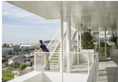
Côté jardin, au sud, les terrasses créent des lieux de travail ou de rencontre informels.

À la pureté des plans répond la sobriété des matériaux mis en œuvre. Ils se limitent au béton , au verre des menuiseries et à l'acier blanc des garde-corps, à l'extérieur ; à de l'espace, de l'air et de la lumière pour ce qui concerne l'intérieur. Économie de moyens ou influence de la récente collaboration des deux concepteurs avec l'architecte japonais Sou Fujimoto pour le projet de l'arbre blanc à Montpellier ?