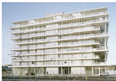
La longueur des débords s'adapte aux orientations. elle est réduite au nord, où un jeu aléatoire de poteaux crée une façade vibrante le long de la nouvelle avenue.

Afin de donner un usage à ces grands débords de dalle, des terrasses accessibles sont tout naturellement venues les animer pour le bien-être des travailleurs.