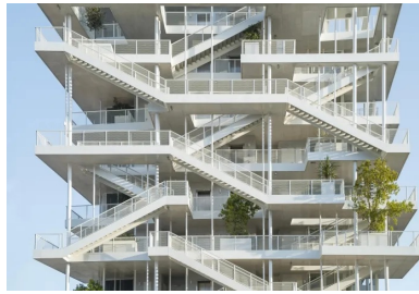
Les circulations verticales communes s'organisent sur les pignons et sont agrémentées de jardinières plantées d'arbres adultes.

apparente la sous-face de la dalle. Celle-ci est traitée en béton brut apparent. La présence intérieure du béton renforce l'inertie du bâtiment et participe au bon confort thermique intérieur.