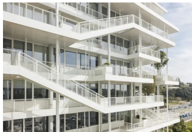
Au sud, des escaliers assurent des liaisons directes entre les différents niveaux pour les entreprises qui en occupent plusieurs.

Cette frugalité s'étend également à l'aspect énergétique du projet. Le suivi des consommations depuis la livraison du bâtiment en janvier 2019 montre 30 % de dépense énergétique en moins que celle de bureaux classiques.