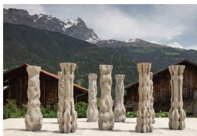
Colonnes imprimées en béton 3D - ETH Zurich

C'est dans un quartier industriel de Shanghai que les piétons peuvent désormais utiliser un pont en béton imprimé 3D. Sa particularité : il est aujourd'hui le plus long du monde réalisé dans cette technologie. D'une longueur de 26,3 mètres et d'une largeur de 3,6 mètres, la passerelle est composée de blocs accolés, qui intègrent des capteurs pour collecter des informations sur les déplacements, dans la perspective d'améliorer la mobilité urbaine et les conceptions futures.