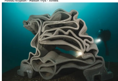
Récifs artificiels - XtreetE / Seaboost