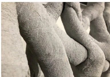
Béton imprimé en 3D - Soliquid

Le monde universitaire accompagne ces évolutions techniques : de nombreuses écoles et universités, partout en Europe, développent des projets de recherche et d'expérimentations. La dernière initiative est portée par l'Ecole Française du Béton, qui vient de lancer le projet « Béton 3D écoles », un projet pédagogique déployé en deux temps : d'abord la fabrication d'une imprimante 3D béton grande taille et low cost, puis des réalisations concrètes avec l'imprimante mise au point. Ce projet concerne initialement plusieurs établissements de l'académie de Nantes, mais à vocation à se développer dans d'autres académies.