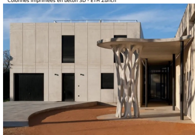
Poteau Krypton - Maison Yrys - XtreetE