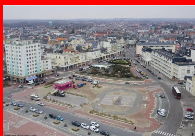
L'Entonnoir est une « patte d'oie » naturellement créée à la fin du XVII e siècle par l'assèchement d'une rivière dont on peut encore deviner le cours.