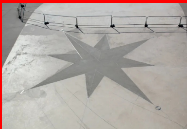
La magnifique rose des vents dont les branches forment des angles aigus, ce qui rend délicate la mise en œuvre du béton - a été réalisée avec un soin tout particulier.