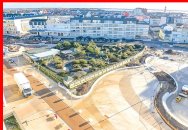
La couleur de base du béton est celle du sable de Berck. Selon le projet de Paysage 360, cette teinte se décline ensuite - du plus sombre au plus clair pour reconstituer les méandres de l'ancienne rivière.

Étape essentielle : la réalisation de la couche de forme. « Elle est constituée d'une grave traitée et recyclée d'une épaisseur de 15 cm sur toutes les plates-formes et de 25 cm pour les voiries, indique Christophe Leprêtre, le conducteur de travaux d'Eurovia. Total : 6 000 tonnes. Pour diminuer l'empreinte carbone, nous avons recyclé la plupart des matériaux sur place, avec criblage et concassage de ceux-ci sur une plate-forme à proximité du chantier. Puis, une fois la couche de forme réalisée, nous avons procédé à la vérification des portances, avant de couler le béton. »