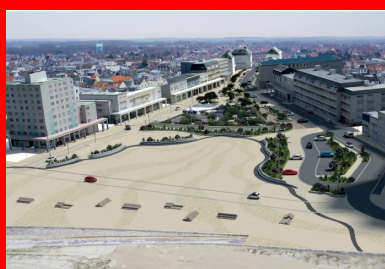
Vue d'artiste du projet.

Précaution d'entretien : il a été conseillé au maître d'ouvrage de ne pas utiliser de sels de déverglaceage pour ne pas altérer la teinte. Sans précaution, le sel peut engendrer des dégradations sur l'esthétique du béton, surtout s'il est coloré et même s'il a reçu une protection antitache et antisalissure, comme c'est le cas ici.