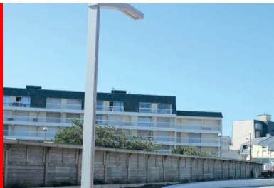
L'éclairage public a été entièrement révisé avec l'utilisation de diodes électroluminescentes (LED).