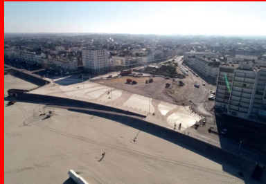
Une première phase de requalification concerne 17 000 m 2 . Quelque 3 200 m 3 de béton ont été mis en œuvre par Eurovia, soit 400 toupies de 8 m 3 .

« Le béton choisi est résistant aux embruns. C'est un ciment CEM III/A 42,5 N LH CE PM ( prise mer) - ES (eaux sulfatées) NF. Il est dosé à 350 kg pour obtenir une résistance de 30 MPa et satisfaire à une classe d'exposition XF 2 pour le cycle gel-dégel. L'entraîneur d'air utilisé génère des microbulles d'air dans le béton, ce qui lui permet de mieux résister au gel en évitant les contraintes dans le béton, précise Frédéric Butel, responsable des sites du secteur littoral EQIOM Bétons de la région Hauts-de-France. Ce ciment CEM III est un ciment latier avec un indice carbone optimisé. Il a une prise plutôt lente, ce qui facilite sa mise en œuvre. » Il est produit à l'usine de Lumbres, située à une quinzaine de kilomètres à l'est de Saint-Omer, toujours dans le Pas-de-Calais (production annuelle : 750 000 t/an).