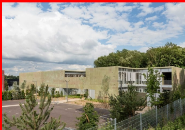
L'enveloppe de béton, travaillée à la manière d'un paysage, se soulève par endroits pour dévoiler sans révéler.

Loin de toute recherche d'abstraction, il souhaitait mettre à nu son essence, son épaisseur, sa composition et créer un paysage dans le paysage, qui confère à cette enveloppe une préhistoire, un vécu, un ensemble de traces dont l'interprétation fluctue en fonction de chacun, à l'instar d'une toile.