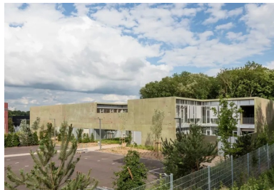
L'enveloppe de béton, travaillée à la manière d'un paysage, se soulève par endroits pour dévoiler sans révéler.

Loin de toute recherche d'abstraction, il souhaitait mettre à nu son essence, son épaisseur, sa composition et créer un paysage dans le paysage, qui confère à cette enveloppe une préhistoire, un vécu, un ensemble de traces dont l'interprétation fluctue en fonction de chacun, à l'instar d'une toile.