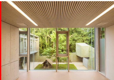
L'ensemble des bureaux et salles de consultation profite d'une vue sur l'extérieur, ici sur le bois.