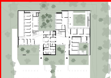
Plan de rez-de-chaussée 1. Hall d'entrée de la partie dédiée aux enfants 2. Hall d'entrée de la partie dédiée aux adultes 3. Zone « tampon » réservée au personnel et séparant les deux parties du centre

À écouter l'ensemble des protagonistes, maîtrise d'œuvre, entreprise de gros œuvre, artiste et maître d'ouvrage ont formé une seule et même équipe. Ils se sont tous approprié le projet, y ont adhéré et ont travaillé main dans la main.