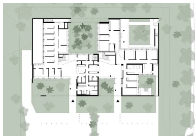
Plan de rez-de-chaussée 1. Hall d'entrée de la partie dédiée aux enfants 2. Hall d'entrée de la partie dédiée aux adultes 3. Zone « tampon » réservée au personnel et séparant les deux parties du centre

À écouter l'ensemble des protagonistes, maîtrise d'œuvre, entreprise de gros œuvre, artiste et maître d'ouvrage ont formé une seule et même équipe. Ils se sont tous approprié le projet, y ont adhéré et ont travaillé main dans la main.