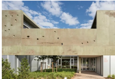
Pour accéder au centre dédié aux enfants, on se glisse sous l'enveloppe de béton protectrice.

Les espaces, quels qu'ils soient, sont baignés de lumière et de percées sur l'extérieur. Dérobées, lorsqu'elles cadrent les espaces « publics », les vues sont franches sur l'ensemble des patios ou sur le petit bois voisin.