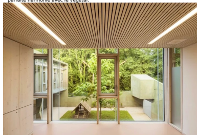
L'ensemble des bureaux et salles de consultation profite d'une vue sur l'extérieur, ici sur le bois.