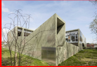
La partie arrière du centre qui longe le bois existant.

Le contexte s'avère être à la fois typique des abords de ville, hétéroclite et en manque de repères urbains forts, tout en offrant un environnement semi-boisé et vallonné. En effet, la parcelle dédiée côtoie tout autant la nature que l'urbain, sise entre un concessionnaire automobile et un espace presque sanctuarisé comprenant des vestiges de fortifications dissimulées dans un petit bois.