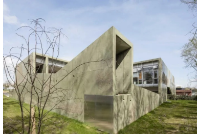
La partie arrière du centre qui longe le bois existant.

Le contexte s'avère être à la fois typique des abords de ville, hétéroclite et en manque de repères urbains forts, tout en offrant un environnement semi-boisé et vallonné. En effet, la parcelle dédiée côtoie tout autant la nature que l'urbain, sise entre un concessionnaire automobile et un espace presque sanctuarisé comprenant des vestiges de fortifications dissimulées dans un petit bois.