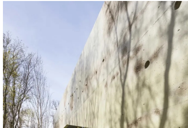
La peau de béton, par sa teinte, ses rugosités et ses anfractuosités, est en parfaite harmonie avec le végétal.

Quant aux espaces de circulation, dégagés et « respirants », ils sont ponctués de cadrages sur le ciel dans les cages d'escalier. Si l'atmosphère intérieure est fortement marquée par le contact au végétal, la douceur qui en découle est renforcée par la présence de bois très clair pour les plafonds et les menuiseries, et par un sol en résine rosée, générant une ambiance parfaitement propice au soin, presque feutrée – un effet renforcé par une très bonne acoustique .