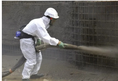
Opérateur de projection en voie mouillée

Dans ce domaine, une bonne expérience est nécessaire. Par ailleurs, il existe également des produits industriels « prêts-à-l'emploi » dont la « projetabilité » a été vérifiée lors d'essais préalables (ou démontrée sur des chantiers antérieurs).