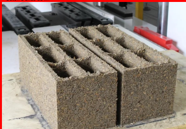
Bloc de béton de miscanthus