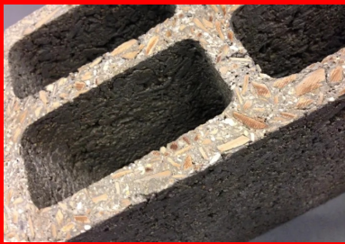
Béton de bois

Dans le bâtiment, en raison de ses vertus acoustiques mais aussi thermiques, le béton de bois est traditionnellement utilisé comme matériau de remplissage dans des structures en ossature bois pour assurer l'isolation ou comme coffrage perdu, ou encore il sert à la réalisation de chapes. Depuis quelques années cependant, les travaux de recherche menés par les industriels ont abouti à la mise au point de blocs porteurs en béton de bois, couramment utilisés pour des bâtiments R+1 et jusqu'à R+3 avec des chaînages béton.