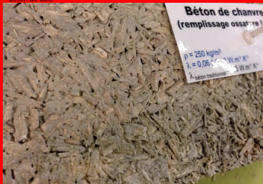
Béton de chanvre