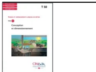
Cet article est extrait de T50. Voiries et aménagements urbains en béton (Tome 1) - Conception et dimensionnement