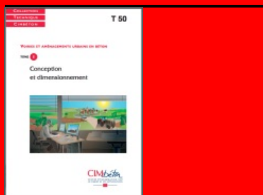
Cet article est extrait de T50. Voiries et aménagements urbains en béton (Tome 1) - Conception et dimensionnement

D'autres paramètres peuvent avoir une influence dans le choix de la technique de construction mais qui sont difficiles à quantifier, comme le coût social et le coût de la sécurité.