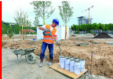
Préparation des tests de performances mécaniques et de tenue dans le temps