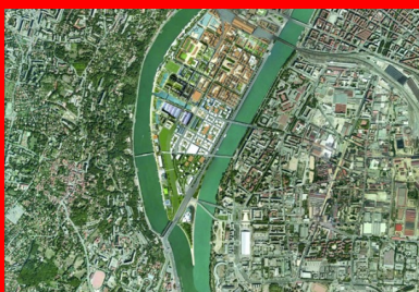
Le nouveau quartier Confluence se situe dans le prolongement du cœur de Lyon, derrière Perrache (II e arrondissement), entre Rhône et Saône.

Les chantiers de dépollution, menés à grande échelle, constituent également la marque du nouveau territoire. Pour la première phase des réalisations, pas moins de 250 000 tonnes de terre ont été extraites et dépolluées dans un centre de traitement. Choisi pour réaliser les espaces publics du Champ, le béton y joue un rôle bien spécifique, au diapason des exigences environnementales.