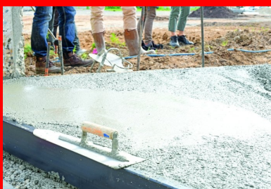
La talochage des premières planches d'ossais s'est effectué manuellement, sans difficulté.

Chargée d'en concevoir le « paysage pionnier », l'agence Base a proposé une « approche naturaliste, inspirée des logiques et des mouvements des rivières dans cette zone, pendant des milliers d'années », explique Jeanne Souvent, paysagiste chez Base. Ainsi, la première parcelle végétalisée est conçue à la manière d'un « laboratoire d'expérimentations ». Ce lieu, baptisé Station Mue, est propice à l'imagination collective ; il fédère des initiatives populaires afin d'accompagner de nouveaux usages de l'espace public et de préfigurer la ville de demain.