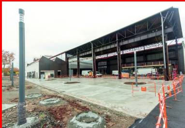
La première mise en œuvre du béton 100 % à base de granulats recyclés a été réalisée par Sols Confluence sur les abords de la nouvelle halle Girard, alias H7-Lyon French Tech. Elle a eu lieu à partir du 14 novembre 2018, en cinq jours de coulage, à raison de 20 à 30 m 3 quotidiens pour une équipe de 3 à 5 personnes, « directement à la troupe et au dumper. »

« Il s'agit d'une première en France, concluent avec satisfaction Jeanne Souvent (agence Base), Nicolas Brasier (Vicat) et Sébastien Thiercé (Sols Confluence). Le nouveau quartier de Lyon Confluence est le lieu idéal pour mener ce type d'expérimentation et pour ouvrir la voie à un béton recyclé aisément utilisable en revêtement de sol, tout en gardant un caractère et une qualité esthétique indéniables. Nous sommes certains que c'est l'avenir ! »