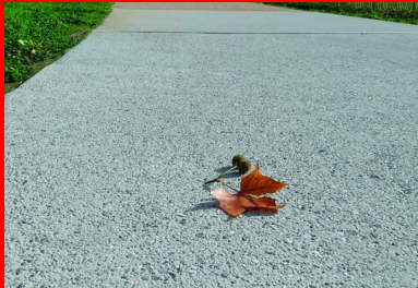
En juin 2018, les premières planches d'essais sont coulées à l'entrée du parc de la Station Mue. « Nous avons commencé par faire de petites planches, puis, de fil en aiguille, des planches de plus en plus grandes, poursuit Nicolas Brasier (Vicat). Finalement, nous avons atteint les objectifs : créer un nouveau béton à partir de rebuts de béton. »