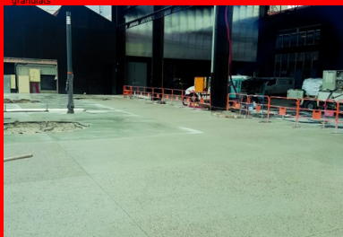
Le nouveau revêtement à une « apparence assez brute, de couleur grise, avec des agrégats roulés visibles, allant de l'ocre au noir. Il assure un bon confort de marche et une bonne adhérence. »

Maîtrise d'ouvrage : SPL Lyon Confluence - Maîtrise d'œuvre : Espaces publics du Champ : Base (paysagiste mandataire), Arcadis, Bruit du frigo, On, EODD ; Espaces publics du quartier du Marché : Atelier Ruelle, Artelia - Mise en œuvre du béton recyclé : Sols Confluence - Fournisseur du béton : Béton Vicat - Fournisseur des granulats : Granulats Vicat - Fournisseur du ciment : Ciment Vicat