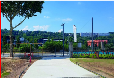
En juin 2018, les premières planches d'essais sont coulées à l'entrée du parc de la Station Mue. « Nous avons commencé par faire de petites planches, puis, de fil en aiguille, des planches de plus en plus grandes, poursuit Nicolas Brasier (Vicat). Finalement, nous avons atteint les objectifs : créer un nouveau béton à partir de rebuts de béton. »