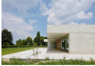
Le volume se creuse pour aménager des lieux de vie extérieurs protégés du soleil et des intempéries par les avancées de toiture.

Pour éviter aux enfants de l'école Roger Balan de devoir traverser la ville afin de rejoindre les locaux des activités périscolaires et la cantine, la ville de Saint-Marcel, voisine de Chalon-sur-Saône, a fait construire un nouvel équipement destiné à remédier à cette situation. Ce nouvel édifice abrite deux ateliers pour l'accueil périscolaire et un restaurant scolaire destinés aux enfants de maternelle et d'élémentaire de l'école Roger Balan située en face, de l'autre côté de la rue de Breuil.