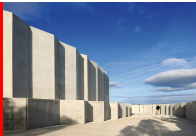
On accède à la grotte latéralement, par une descente en rampe, accompagné par des parois béton de panneaux préfabriqués à coffrage intégré.

Nous avons tenté d'avoir la même concentration artistique que celle des artistes de la grotte, et avons cherché à l'extérieur à traduire de façon abstraite la triangulation du relevé 3D des parois, mettant en œuvre la même technique de béton projeté qu'à l'intérieur. Seule, l'utilisation de ce matériau apportait la masse et la résonance d'une véritable grotte. En façade , le challenge a été de réaliser une triangulation qui ne soit pas trop fine pour être perceptible de loin. Associées aux pili, aux fissures, les facettes communiquent avec la nature environnante. De loin et avec le soleil, les 100 m de long et 14 m de haut du bâtiment deviennent une véritable falaise reconstituée. « Comme dans la grotte d'origine, l'entrée est plein sud, à l'opposé du point d'arrivée du sentier. On y accède latéralement par une descente en rampe. Les architectes en ont profité pour préparer les visiteurs à la puissance artistique des dessins, comme si chaque pas faisait remonter le temps et mettait en condition sensorielle. Le parcours devient initiatique. On descend accompagné par des parois en béton, constituées de panneaux préfabriqués à coffrage intégré. Lisse, leur aspect de surface est presque glacé. Leur pose en lignes brisées, comme dans un canyon, trace une triangulation progressive d'abord simplement en deux dimensions.