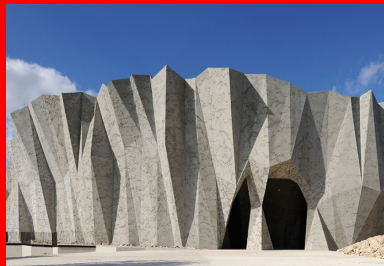
L'écriture architecturale de la réplique réinterprète le relevé 3D de la caverne et sa triangulation.

Garants et dépositaires de ce patrimoine unique, l'État, le conseil régional de Rhône-Alpes et le conseil général de l'Ardèche se sont mobilisés pour conduire ce projet de restitution et d'interprétation, lançant une consultation en 2009. Le site choisi est à la hauteur de la grotte, 12 hectares recouverts de chênes verts, au Razal, sur les hauteurs de Vallon-Pont-d'Arc. Il offre à son extrémité sud des vues sur la vallée et les contreforts de l'Ardèche au même titre que la cavité d'origine.