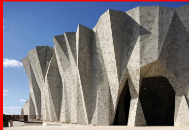
Du nord au sud, le bâtiment passe du lisse du béton préfabriqué à la rugosité du béton projeté et soufflé.

Sur les autres pôles, les panneaux matricés sont repris comme éléments architectoniques d'encadrement de fenêtre ou de sous-face de dalle. Ils confèrent à l'écriture architecturale une ligne actuelle. Elle se marie parfaitement à la pierre sèche qui habille les murs. La couleur blonde du béton reprend la teinte de cette belle pierre d'Ornac dans une alliance que les architectes ont volontairement affirmée avec la nature et au-delà du temps.