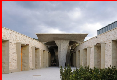
Le pôle accueil est traité comme une étroiture entre deux murs courbes habillés de pierre d'orgnac, à l'abri d'un grand auvent.

L'agence d'architecture Fabre et Speller, associée avec l'Atelier 3A, lauréats du concours, ont considéré la qualité de ce paysage avec grand soin, cherchant à l'exprimer au travers d'un projet où Nature et Architecture s'accordent. Du pont sur l'ibie, on n'aperçoit que les « falaises reconstituées » de la réplique, vaisseau amiral du projet. Il faut prendre de la hauteur pour découvrir la véritable empreinte, presque naturaliste, du projet dans le paysage. La Caverne du Pont-d'Arc n'est pas un bâtiment monolithique mais une structure éclatée en cinq pôles, entre lesquels on chemine sur des sentiers. La combinaison des itinéraires laisse au visiteur le choix et rythme le parcours au milieu des chênes et des buis centenaires. Depuis le parking, un premier effet de clairière invite le visiteur vers l'entrée. Ce premier seuil longe une étroiture entre deux murs courbes à l'abri d'un grand auvent.