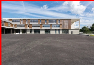
Peintes ou revêtues de bois ligné, les façades courantes s'inscrivent entre des éléments horizontaux en béton blanc.

Grâce à son gabarit urbain, l'établissement est perceptible depuis le parvis de la gare. Sa volumétrie générale est unifiée par un rez-de-chaussée faisant socle dans lequel sont aménagés les espaces d'administration, de restauration et d'étude. Ce niveau supporte les deux éléments majeurs de la composition, d'une part, l'aile nord dont les deux étages regroupent 21 salles de classe disposées orthogonalement à la voie ferrée et, d'autre part, le bâtiment d'entrée constitutif de la base du U. Faisant face au parvis, ce dernier est habillé d'une trame de brise-soleil verticaux qui gèrent l'ensoleillement du hall sur lequel donne la mezzanine du CDI. Il se poursuit par une aile abritant dans ses étages le foyer des enseignants et des logements.