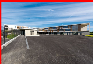
La composition en U minimise l'impact acoustique de la voie ferrée et protège les espaces extérieurs des vues depuis la rue.

L'établissement est composé selon une figure en U offrant ses pignons en vis-à-vis des voies ferrées. Cette disposition minimise l'impact acoustique des trains sur les locaux d'enseignement et protège la cour de récréation et l'aire d'évolution sportive des vues depuis la rue. Le positionnement des immeubles sur pilotis, avec le plancher du rez-de-chaussée à 1,30 m au-dessus du sol naturel, résulte pour sa part des prescriptions du Plan de prévention des risques inondations. Peu perceptible mais bien présente, la surélévation du rez-de-chaussée préserve les possibilités d'écoulement des eaux en cas de crue. Elle est gérée au niveau de l'entrée principale par un emmarchement et, de part et d'autre du parvis, par l'intégration dans le sol de rampes assurant l'accessibilité des personnes à mobilité réduite. Les murs en béton gris coffrés à la planche du local vélo et un grand portique en béton blanc complètent la mise en scène de l'accès au bâtiment.