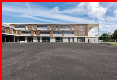
Peintes ou revêtues de bois ligné, les façades courantes s'inscrivent entre des éléments horizontaux en béton blanc.

Grâce à son gabarit urbain, l'établissement est perceptible depuis le parvis de la gare. Sa volumétrie générale est unifiée par un rez-de-chaussée faisant socle dans lequel sont aménagés les espaces d'administration, de restauration et d'étude. Ce niveau supporte les deux éléments majeurs de la composition, d'une part, l'aile nord dont les deux étages regroupent 21 salles de classe disposées orthogonalement à la voie ferrée et, d'autre part, le bâtiment d'entrée constitutif de la base du U. Faisant face au parvis, ce dernier est habillé d'une trame de brise-soleil verticaux qui gèrent l'ensoleillement du hall sur lequel donne la mezzanine du CDI. Il se poursuit par une aile abritant dans ses étages le foyer des enseignants et des logements.