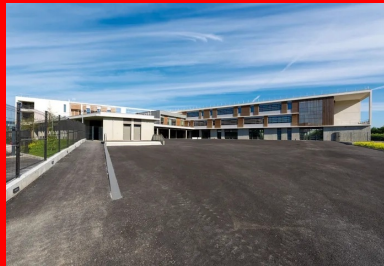
La composition en U minimise l'impact acoustique de la voie ferrée et protège les espaces extérieurs des vues depuis la rue.

L'établissement est composé selon une figure en U offrant ses pignons en vis-à-vis des voies ferrées. Cette disposition minimise l'impact acoustique des trains sur les locaux d'enseignement et protège la cour de récréation et l'aire d'évolution sportive des vues depuis la rue. Le positionnement des immeubles sur pilotis, avec le plancher du rez-de-chaussée à 1,30 m au-dessus du sol naturel, résulte pour sa part des prescriptions du Plan de prévention des risques inondations. Peu perceptible mais bien présente, la surélévation du rez-de-chaussée préserve les possibilités d'écoulement des eaux en cas de crue. Elle est gérée au niveau de l'entrée principale par un emmarchement et, de part et d'autre du parvis, par l'intégration dans le sol de rampes assurant l'accessibilité des personnes à mobilité réduite. Les murs en béton gris coffrés à la planche du local vélo et un grand portique en béton blanc complètent la mise en scène de l'accès au bâtiment.