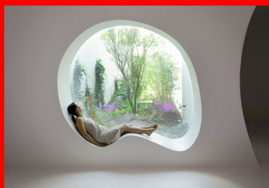
Fenêtre arrondie ouverte sur un jardin.

L'architecture de la grande salle existante, où sont situés les deux bassins, est préservée. La structure inclinée est mise en valeur et accompagnée par un jeu d'obliques qui apporte une touche contemporaine. La pataugeoire des petits offre un cocon où les enfants se sentent enveloppés. L'espace est courbe, atténuant naturellement la réverbération des sons. La grande baie en hauteur inonde de soleil le petit bassin arrondi. Ce lieu est conçu pour marquer l'imaginaire des enfants. La grande terrasse extérieure est traitée comme une plage. Ses garde-corps hauts assurent l'intimité des baigneurs.