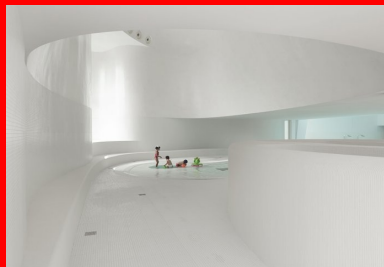
Vue sur la pataugeoire

Les parcours sont fluides, les courbes remplacent l'angle droit. L'espace de distribution est noyé dans une lumière aquatique étrange. Un hublot horizontal, au fond de la pataugeoire des petits, y diffuse une lumière bleutée qui ondule au gré de l'eau. Dans la salle de repos en double hauteur, les formes courbes englobent l'espace. Une belle fenêtre arrondie cadre sur un jardin.