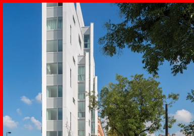
Un jeu de lames en béton comme signal dans la ville.

Ancré sur une étroite parcelle triangulaire dominant la bretelle d'accès du boulevard périphérique et les voies ferrées de la ligne Montparnasse, ce bâtiment en proue est l'œuvre de l'Atelier Jacques Ripault. Pour déjouer par une double approche plastique et technique les difficultés de la parcelle, l'architecte mobilise toutes les capacités du béton fibré à ultra hautes performances pour exprimer le dessin de son projet. Caractérisé par une terrasse en vigie face à la ville et par l'opalescence légère de son rez-de-chaussée, l'édifice accueille une résidence de 67 logements étudiants. Dominant les voies ferrées du haut de ses circulations, l'architecture offre des vues panoramiques inédites sur la ville.