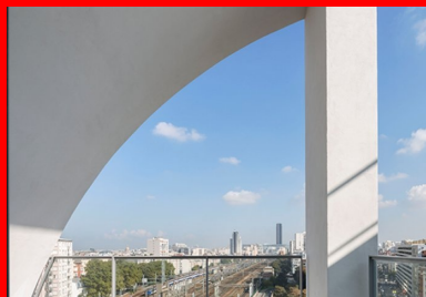
Panorama inédit sur les voies ferrées.

Pour les architectes confrontés au programme des résidences d'étudiants, tenir compte des contraintes d'accessibilité aux personnes à mobilité réduite tend à devenir un casse-tête. Donner une sensation d'espace et de confort dans une surface réduite moyenne de 18 m 2 en intégrant à la fois une salle de bains répondant à ces normes, une kitchenette, un bureau et un lit devient ainsi un réel enjeu. C'est par le traitement du mobilier et en jouant sur l'inflexion des couloirs de distribution des étages que Jacques Ripault y répond. Le plan des studios suit ainsi l'ondulation des couloirs dont le tracé fait écho aux avancées de la façade urbaine qui se décale plus ou moins vers l'extérieur.