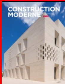
Cet article est extrait de Construction Moderne n°146

Aracadi PLA - Surface : 2 241 m 2 SHON + 650 m 2 de parking - Coût : 5,3 M€ HT (hors mobilier, valeur 2012) - Programme : médiathèque, ludothèque, auditorium, parking.