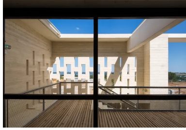
Claustra qui protège l'angle de la terrasse et donne à cet endroit une intimité et une protection, qui contrastent avec la vue panoramique vers la mer.

d'entrée et en relation visuelle avec les deux étages à travers l'escalier qui lui fait face. Au même niveau, la zone réservée aux enfants s'étire le long de la façade sud avec une ludothèque, des salles de contes et de consultation. L'auditorium qui occupe l'angle nord-est peut, avec la buvette escamotable située dans le hall d'entrée, fonctionner de manière indépendante.