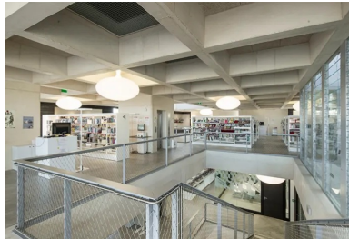
Pallier du deuxième étage. À droite, la boîte à lumière et à vent qui permet d'éclairer le cœur du bâtiment.

Ce système (GBE) a nécessité une vitesse contrôlée de coulage à raison d'un mètre par heure afin d'éviter une surpression au niveau du pied de banche : chaque étage a été coulé en trois passes. Ces solutions constructives et architecturales s'accompagnent d'un travail précis sur l'orientation et les dimensions des ouvertures. Au sud, de profondes embrasures de hauteur d'étage limitent la pénétration des rayons du soleil. Les baies vitrées orientées à l'est sont mises en retrait de la façade par un escalier extérieur et une terrasse, délimités par un portique en béton formant brise-soleil. L'orientation ouest, la plus protégée, se singularise par de hautes entailles biaisées, sortes d'« ouïes » dont les vitrages orientés au nord apportent une lumière indirecte. Une grande baie vitrée horizontale ouvre la façade nord, presque au nu de la paroi extérieure.