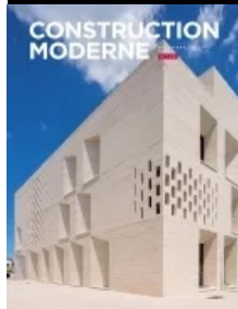
Cet article est extrait de Construction Moderne n°146

Maître d'ouvrage : Thau Agglo - Assistant maîtrise d'ouvrage HQE® : Aubaine - Maître d'œuvre : Tautem architecture, Dominique Delord et Jacques Garcin architectes mandataires ; bmc2, Arnaud Bical et Laurent Courcier architectes associés ; Julien Gavet, chef de projet - BET structure ; Charles Portefaix - Entreprise gros œuvre et serrurerie ; Aracadi PLA - Surface : 2 241 m 2 SHON + 650 m 2 de parking - Coût : 5,3 M€ HT (hors mobilier, valeur 2012) - Programme : médiathèque, ludothèque, auditorium, parking.