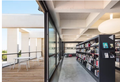
La salle de lecture du deuxième étage s'étend à l'extérieur en une terrasse d'où l'on aperçoit la mer.

Frontignan, autrefois banlieue industrielle de Sète, fait partie de ces communes qui se déroulent le long d'une route nationale, ici, entre les vignes et la mer dont elle est séparée par une succession d'infrastructures viaires et ferroviaires, le canal du Rhône, l'étang d'Ingril et la lagune. La fermeture de sa raffinerie de soufre en 1989 et le rachat de son site par la municipalité offrent l'occasion de repenser son urbanisation. Un premier projet de zone d'activité économique et artisanale est abandonné au profit d'un écoquartier répondant à l'arrivée de nouveaux habitants comme à la nécessité de restructurer et de renforcer ce territoire urbain proche de Montpellier. Soucieux de tirer parti des spécificités climatiques méditerranéennes et des qualités paysagères du terrain, mais aussi d'éviter des solutions technologiques dispendieuses, l'architecte-urbaniste Pierre Tourne, coordonnateur de la Zac, élabore un cahier des charges visant la « sobriété énergétique ».