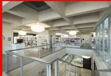
Pallier du deuxième étage. À droite, la boîte à lumière et à vent qui permet d'éclairer le cœur du bâtiment.

Ce système (GBE) a nécessité une vitesse contrôlée de coulage à raison d'un mètre par heure afin d'éviter une surpression au niveau du pied de banche ; chaque étage a été coulé en trois passes. Ces solutions constructives et architecturales s'accompagnent d'un travail précis sur l'orientation et les dimensions des ouvertures. Au sud, de profondes embrasures de hauteur d'étage limitent la pénétration des rayons du soleil. Les baies vitrées orientées à l'est sont mises en retrait de la façade par un escalier extérieur et une terrasse, délimités par un portique en béton formant brise-soleil. L'orientation ouest, la plus protégée, se singularise par de hautes entailles biaisées, sortes d'« oûtes » dont les vitrages orientés au nord apportent une lumière indirecte. Une grande baie vitrée horizontale ouvre la façade nord, presque au nu de la paroi extérieure.