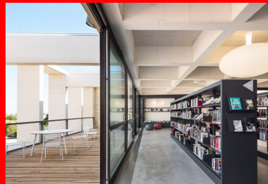
La salle de lecture du deuxième étage s'étend à l'extérieur en une terrasse d'où l'on aperçoit la mer.

Frontignan, autrefois banlieue industrielle de Sète, fait partie de ces communes qui se déroulent le long d'une route nationale, ici, entre les vignes et la mer dont elle est séparée par une succession d'infrastructures viaires et ferroviaires, le canal du Rhône, l'étang d'Ingril et la lagune. La fermeture de sa raffinerie de soufre en 1989 et le rachat de son site par la municipalité offrent l'occasion de repenser son urbanisation. Un premier projet de zone d'activité économique et artisanale est abandonné au profit d'un écoquartier répondant à l'arrivée de nouveaux habitants comme à la nécessité de restructurer et de renforcer ce territoire urbain proche de Montpellier. Soucieux de tirer parti des spécificités climatiques méditerranéennes et des qualités paysagères du terrain, mais aussi d'éviter des solutions technologiques dispendieuses, l'architecte-urbaniste Pierre Tourre, coordonnateur de la Zac, élabore un cahier des charges visant la « sobriété énergétique ».