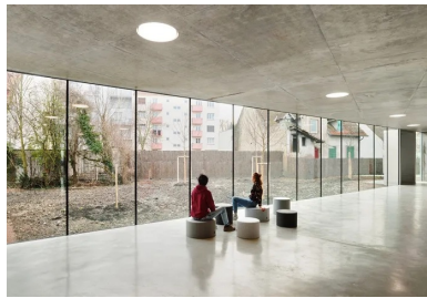
Le hall vitré sur le jardin dessert tous les vestiaires.

Conçu par l'agence d'architecture Dominique Coulon & associés, le centre sportif des Droits de l'homme établit un dialogue avec l'école européenne. « Notre projet prolonge la logique des fragments déjà mise en œuvre pour le bâtiment de l'école européenne. Les volumes des deux salles sont dissociés et pivotés, ce qui permet de placer la grande salle dans une situation idéale. Perpendiculaire à la rue et implantée en limite nord de la parcelle, sa position minimise l'impact du bâtiment dans le site. Toute la profondeur de la parcelle est utilisée, le bâtiment offre un linéaire plus court vers la rue, il donne plus de porosité vers le paysage. Le hall est transparent. Il laisse voir depuis le parvis le bois à l'arrière de la parcelle. Une couronne programmatique, accueillant les vestiaires et locaux annexes, entoure les deux salles, tout en ménageant des vues à la fois vers l'extérieur et entre elles », explique l'architecte Dominique Coulon.