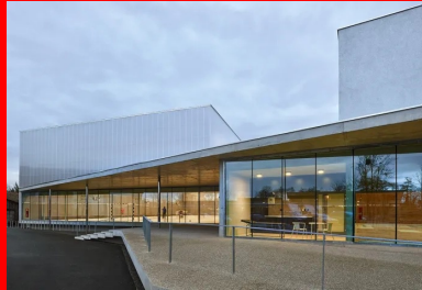
Vue depuis le parvis.

Son modèle pédagogique est fondé sur une approche multiculturelle, une ouverture très grande aux langues, ainsi que sur l'autonomie de l'enfant et une place importante laissée aux parents dans l'école.