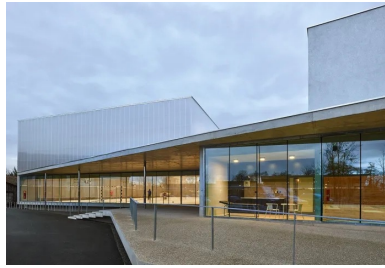
Vue depuis le parvis.

Son modèle pédagogique est fondé sur une approche multiculturelle, une ouverture très grande aux langues, ainsi que sur l'autonomie de l'enfant et une place importante laissée aux parents dans l'école.