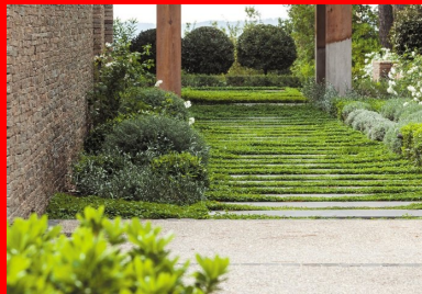
A l'autre extrémité du jardin, l'accès aux espaces de vie.