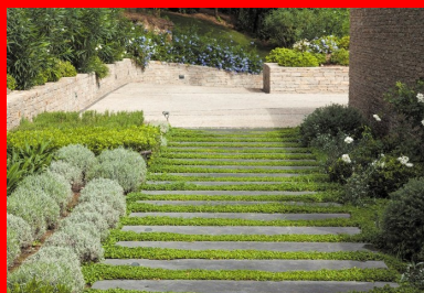
Originalité : un escalier végétalisé aux marches allongées menant à la résidence.

La société MB Constructions est intervenue sur cette chaussée en courbe, une fois les autres travaux achevés. L'entreprise a mis en œuvre un béton à la tonalité méditerranéenne, avec un granulat couleur ocre gris (6/16 de la Durance) sur une surface de 960 m 2 et une épaisseur de 12 cm. Largeur de la voie : 4,50 m.