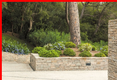
Les arbres classés ont été préservés et mis en valeur.

Ensuite, pour le choix des coloris et des textures. La gamme à présenter aux clients est large, et il est rare qu'ils ne trouvent pas leur bonheur. Enfin, pour la rapidité de mise en œuvre, la tenue en pente et la facilité d'entretien (avec l'utilisation de produit antitache). Et donc, au final, avec un bon rapport qualité-prix. »