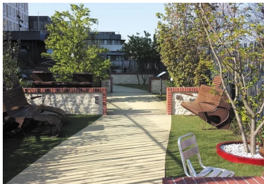
Le jardin est composé de plusieurs espaces délimités par des murets d'un mètre de hauteur, travaillés en pierre de Caen et en brique.