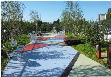
Cet espace de détente de 80 m2 en béton coloré et finement sablé arbore un arlequin rouge, noir, jaune et bleu en béton lissé, spatulé et gravé.

Couronné aux Victoires du Paysage, le jardin compte parmi les tout premiers de ce type en France.