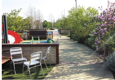
une allée centrale dessert l'ensemble du jardin pour finir dans une impasse.

Nous étions aux portes du centre hospitalier, ce qui imposait un taux de poussière égal à zéro ! Toutes les découpes ont été faites à l'eau. Nous avons également planifié les travaux pour ne pas faire de bruit durant les heures de traitement des malades. Il fallait canaliser le plus possible les nuisances. »