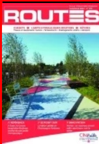
Cet article est extrait de Routes n°134

Maitrise d'ouvrage : Centre de lutte contre le cancer François Baclesse, à Caen (14) - Maitrise d'œuvre : Atelier de paysage Zenobia - Entreprise mandataire : Minéral Service Lot n°2 Maçonnerie et revêtements de sol - Fournisseur du béton : Cemex - Fournisseur du ciment : Calcia - Fournisseur du désactivant : Chryso - Pépinéristes : Vivaces de l'Odon, Jardin Service et Pépinières Soupe