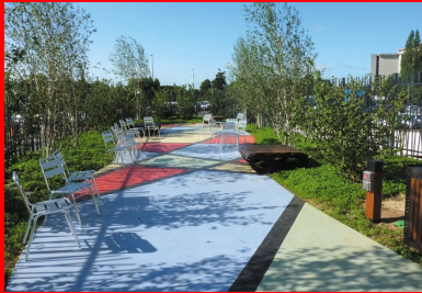
Cet espace de détente de 80 m2 en béton coloré et finement sablé arbore un arlequin rouge, noir, jaune et bleu en béton lissé, spatulé et gravé.

Couronné aux Victoires du Paysage, le jardin compte parmi les tout premiers de ce type en France.