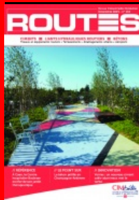
Cet article est extrait de Routes n°134

Maitrise d'ouvrage : Centre de lutte contre le cancer François Baclesse, à Caen (14) - Maitrise d'œuvre : Atelier de paysage Zenobia - Entreprise mandataire : Minéral Service Lot n°2 Maçonnerie et revêtements de sol - Fournisseur du béton : Cemex - Fournisseur du ciment : Calcia - Fournisseur du désactivant : Chryso - Pépinéristes : Vivaces de l'Odon, Jardin Service et Pépinières Soupe