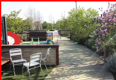
une allée centrale dessert l'ensemble du jardin pour finir dans une impasse.

Nous étions aux portes du centre hospitalier, ce qui imposait un taux de poussière égal à zéro ! Toutes les coupes ont été faites à l'eau. Nous avons également planifié les travaux pour ne pas faire de bruit durant les heures de traitement des malades. Il fallait canaliser le plus possible les nuisances. »