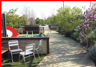
une allée centrale dessert l'ensemble du jardin pour finir dans une impasse.

Nous étions aux portes du centre hospitalier, ce qui imposait un taux de poussière égal à zéro ! Toutes les découpes ont été faites à l'eau. Nous avons également planifié les travaux pour ne pas faire de bruit durant les heures de traitement des malades. Il fallait canaliser le plus possible les nuisances. »