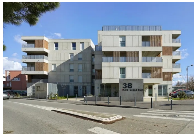
Tous les logements sont dotés de balcons ou de loggias qui forment des avancées ou des espaces en creux, créant des perspectives variées depuis la rue.

Le projet des Carrés de Bellefontaine est composé de 7 plots articulés autour d'un patio central mi-planté mi-minéral, à la manière des jardins toulousains, que l'on ne découvre qu'une fois passée la porte cochère. Ici, les petits immeubles forment une sorte de protection à l'espace central très intime de la cour intérieure.