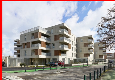
La conception en petits volumes à R+4 introduit une échelle humaine au sein du quartier.

Pour saisir la teneur du projet de l'agence, il semble nécessaire de revenir un instant sur les grands principes qui régissent sa démarche architecturale