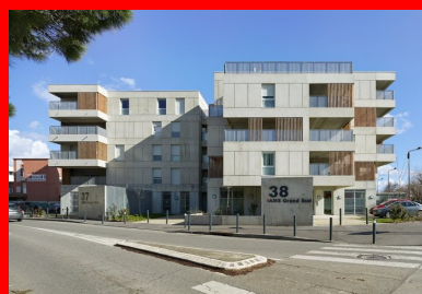
Tous les logements sont dotés de balcons ou de loggias qui forment des avancées ou des espaces en creux, créant des perspectives variées depuis la rue.

Le projet des Carrés de Bellefontaine est composé de 7 plots articulés autour d'un patio central mi-planté mi-minéral, à la manière des jardins toulousains, que l'on ne découvre qu'une fois passée la porte cochère. Ici, les petits immeubles forment une sorte de protection à l'espace central très intime de la cour intérieure.