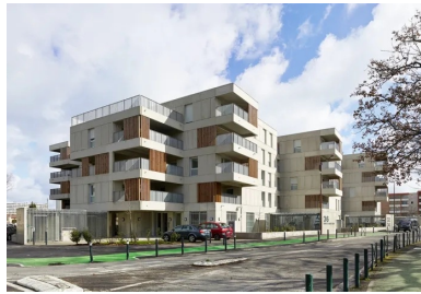
La conception en petits volumes à +4 introduit une échelle humaine au sein du quartier.

Pour saisir la teneur du projet de l'agence, il semble nécessaire de revenir un instant sur les grands principes qui régissent sa démarche architecturale