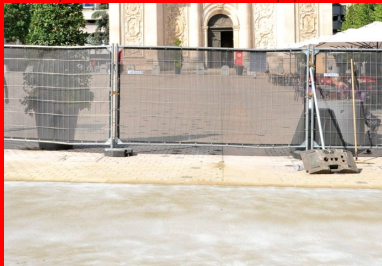
La rue Raugraff est située dans un périmètre historique. Sa rénovation avec du BAC a nécessité l'accord et le suivi des architectes des Bâtiments de France.