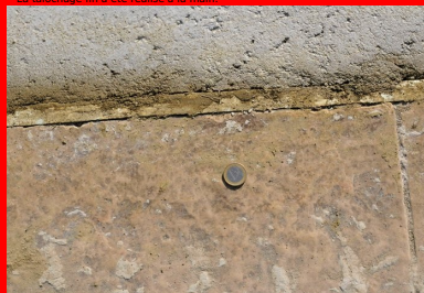
Détail après talochage fin.