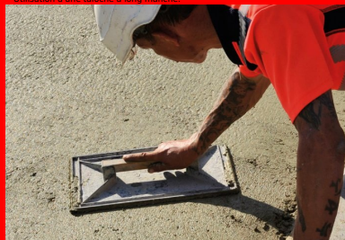
La talochage fin a été réalisé à la main.