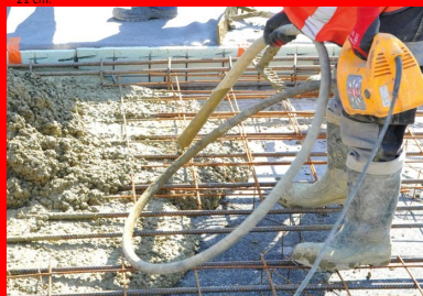
Une aiguille vibrante est utilisée pour chasser les bulles d'air et assurer une bonne compacité.