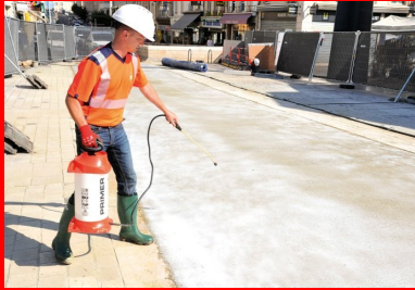
Pulvérisation du produit de cure (Pieri Easy Cure).