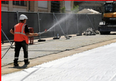
Un géotextile est déployé pour protéger la nouvelle chaussée. But : renforcer encore la prise du béton. Il sera arrosé toutes les heures jusqu'au soir.