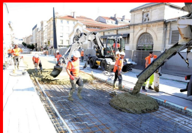
Le béton est délivré directement à la goulotte, puis réparti sur une épaisseur de 23 cm.

Les carottages réalisés par le Cerema-Laboratoire de Nancy ont révélé une couche de forme hétérogène, composée d'une grave traitée en mauvais état dans une zone et de sable stabilisé dans les deux autres. La composition de la couche de fondation varie également, avec cependant deux zones en très bon état constituées de pavés reposant sur un sable stabilisé.