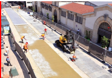
Du premier plan à l'arrière-plan, les différentes étapes du chantier : lissage, pulvérisation du produit de cure, déploiement du géotextile.