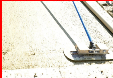
Utilisation d'une taloche à long manche.