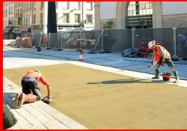
Achèvement des travaux devant l'entrée du marché couvert.

Finalement, le choix s'est arrêté sur un béton coloré avec des effets de texture, en l'occurrence une alternance de surfaces ponçées et bouchardés reprenant le concept et les motifs déployés sur la place Charles-III, la teinte beige clair (avec traitement de surface et utilisation d'un fixateur) se rapprochant le plus possible de la coloration des pavés situés sur la place. Les Bâtiments de France ont donné leur feu vert.