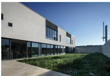
La grande salle s'ouvre sur l'espace clos de l'oratoire extérieur.

« Le projet se compose de deux volumes, l'un au rez-de-chaussée et l'autre au R+1, qui jouent sur des glissements de l'un par rapport à l'autre dans les deux directions, à la fois dans le sens perpendiculaire et dans le sens parallèle. Ce travail est souligné par les matériaux des façades. L'enveloppe du rez-de-chaussée est en béton brut de décoffrage et celle de l'étage en enduit blanc », explique Antoine Péliissier de l'agence Agapé architectes. Dans cet esprit, les deux parois latérales de la salle d'étude se prolongent vers l'extérieur et dessinent le mur de clôture de l'espace de l'oratoire extérieur qui est tenu par les lignes pures et la géométrie orthogonale des voiles de béton.