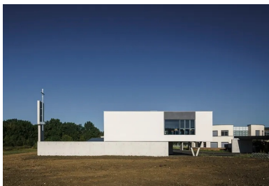
Le projet se compose de deux volumes qui jouent sur des glissements de l'un par rapport à l'autre.

L'extension s'inscrit dans la continuité du gabarit à R+1 du bâtiment existant. En plan masse, elle se dispose perpendiculairement à ce dernier, auquel elle est reliée, à l'étage, par une galerie fermée. Le premier étage est occupé par le pôle administratif et les six nouvelles classes, la galerie les relie directement à la partie déjà existante. Le CDI et la grande salle d'étude s'organisent au rez-de-chaussée.