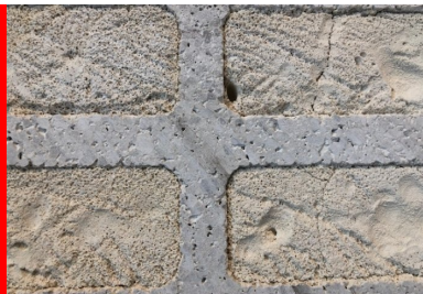
bloc béton isolant mousse minérale