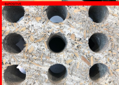
Bloc béton isolant