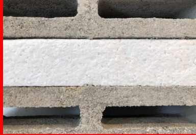
bloc béton isolant PSF