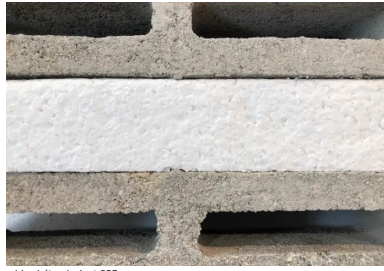
bloc béton isolant PSE