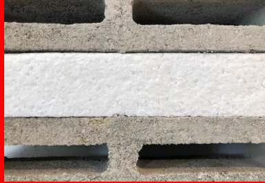
bloc béton isolant PSF