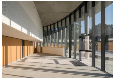
Le plafond du hall principal, façon faux plafond en béton gris autoplaçant, « suspendu » à la dalle porteuse des étages supérieurs.

Autre point remarquable, le plancher à double dalle correspondant au plafond du hall principal en double hauteur. Il permet de dévoyer les gaines et « d'absorber » la retombée de poutre de 1 m, laquelle supporte les étages supérieurs des chambres. Ce plancher se compose d'une dalle porteuse et d'une dalle en béton autoplaçant fonctionnant comme un faux plafond « suspendu » avec éclairage intégré, grâce aux réservations prévues au moment du coulage.