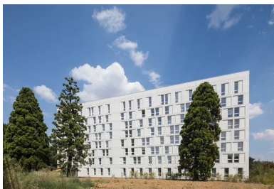
La façade ouest, plus fermée car exposée aux nuisances et composée de panneaux de béton blanc dépolluant.

La Cité internationale universitaire de Paris (CIUP) peut être qualifiée de lieu d'exception par son échelle, par la diversité de ses architectures et par la surface de son parc. Aussi, chaque nouvelle construction relève de l'événement, notamment parce que la dernière en date remonte à 1969. La Maison de la Corée, qui ouvre ses portes cet automne, amorce la densification souhaitée de la Cité, avec 10 nouvelles maisons programmées, soit environ 1 800 logements venant s'ajouter aux 6 000 déjà existants. Pour atteindre cet objectif, les parcelles dédiées aux nouvelles constructions se situent pour la plupart à la lisière du boulevard périphérique, la zone la moins dense de cet ensemble immobilier – un contexte à fortes nuisances, bruit et pollution, qui impliquait une réponse adaptée. Tel fut le cas pour la Maison de la Corée. La proximité de cette 4 voies est devenue un des points forts du projet lauréat, déclinant la créativité des architectes.