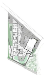
Plan de rez-de-chaussée haut 1. Épicerie 2. Restaurant coréen 3. Salle polyvalente 4. Accueil 5. Pôle d'administration 6. Patio coréen rez-de-chaussée bas

Le volume construit, s'il déploie une géométrie aux lignes simples, fait preuve d'une grande pertinence quant à son implantation, à sa composition et à l'orientation des éléments qui le constituent. Et plutôt que de parler de faces pour l'ensemble de ce bâtiment au volume atypique, il serait plus juste de parler d'un développé de façade qui se déroule et dont la nature se modifie en fonction de son environnement , plus ou moins ouvert ou protégé selon les besoins et les nuisances. Par cette volumétrie, la Maison de la Corée tend ses bras vers le parc tout en donnant un sentiment de bienvenue au passant.