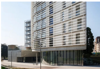
Une architecture faite de pleins et de vides, et de lignes, à la fois souples et épurées.

Précisément, le programme et la configuration de la parcelle ont amené les architectes à définir un projet à trois orientations majeures. Une partie des chambres, exposées nord-est, compose une façade de balcons, particulièrement vitrée, qui se déroule face au parc de la CIUP. La façade ouest, largement exposée aux nuisances du boulevard périphérique, accueille l'autre partie des chambres et logements. Cette façade, plus fermée, a été pensée comme un élément monolithique entièrement réalisé par l'empilement d'éléments en béton préfabriqué blanc. Côté sud, face au boulevard périphérique, la façade présente un linéaire réduit, dédié aux cuisines collectives d'étage et aux salles de restauration, protégées par une double peau composée de brise-soleil et de coursives d'entretien renforçant l'isolation thermique et acoustique d'un mur rideau performant.